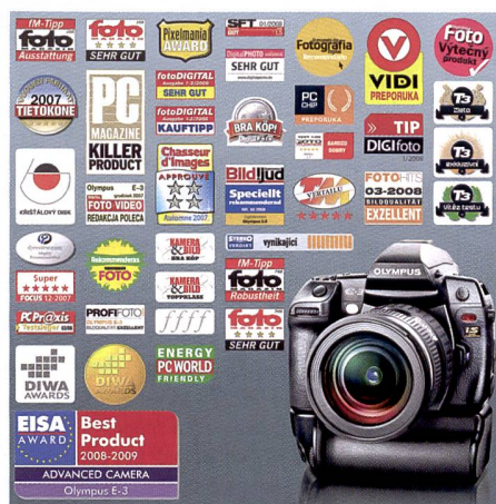
Un petit aperçu de la collection de récompenses de l'E-3. Les spécialistes ne tarissent pas d'éloges vis-à-vis du produit phare d'Olympus.

l'Olympus E-3 a été couronné récemment «Best Advanced Camera 2008/09». Par ailleurs, le compact étanche et extrêmement robuste Olympus \mu 1030 SW a également remporté un prix, en l'occurrence celui de «Best Product» dans la catégorie «Ultra Compact Camera».