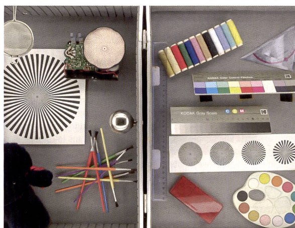
La qualité des images est évaluée à l'aide de clichés de comparaison. Pour garantir un bon résultat, l'objectif est tout aussi important que l'appareil photo lui-même (source: gfw.de)

sateurs d'appareils photo, qu'ils soient photographes professionnels ou amateurs. Si ces utilisateurs plébiscitent un modèle spécifique parce qu'il répond à leurs besoins, ce dernier a pour ainsi dire remporté le test - indépendamment des conclusions de tests publiées dans les revues spécialisées et les forums en ligne.