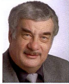
Urs Tillmanns Photographe, journaliste spécialisé et éditeur de Fotointern

La photokina est encore dans tous les esprits. Elle est à nouveau le sujet principal de notre revue puisque nous passons au crible les éclairages et autres accessoires. Ce sont souvent les petites choses qu'il est intéressant de découvrir sur les salons et pour lesquelles les fabricants et les importateurs peuvent difficilement faire de la publicité. Ces accessoires n'en sont pas moins indispensables pour les photographes.