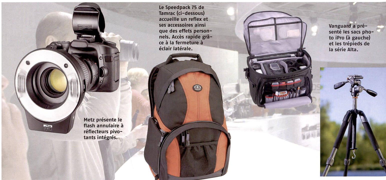
Le Speedpack 75 de Tamrac (ci-dessous) accueille un reflex et ses accessoires ainsi que des effets personnels. Accès rapide grâce à la fermeture à éclair latérale.

Erno lance Alta de Vanguard, une nouvelle gamme économique de trépieds. La colonne centrale est dotée d'une bague antichoc amortissant toute descente intempestive du mécanisme. L'extrémité inférieure de la