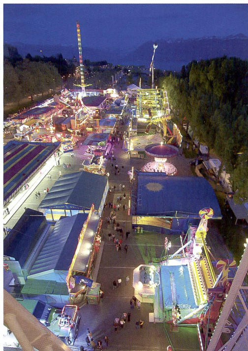
En route avec l'objectif lumineux Zuiko Digital Pro f/2,8-3,5 / 11 - 22 mm : photo de reportage de Daniel Kägi [E-3; 1/20s; 1:2,8; 400 ISO; stabilisateur d'image].

Des questions? – «Mister E» Christian Reding se réjouit de vos appels.