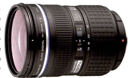
Extrêmement lumineux: f/2,0 /14 - 35 mm (équi. 28 - 70 mm).

Le mois de décembre n'est pas encore là, mais les villages et villes suisses vont néanmoins installer leurs illuminations de Noël dans les semaines à venir. La balance automatique des blancs est très fiable également pour ce type de photos. Amusez-vous quand même à expérimenter différents réglages de la balance des blancs. Si vous testez les possibilités du format RAW (.ORF) d'Olympus, la balance des blancs peut être modifiée ultérieurement sur un Mac/PC. Ne laissez pas passer cette occasion de réaliser cette année vos propres cartes de vœux, bien sûr avec un appareil du système E ;)