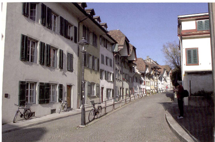
Dans les prises de vue comme celle-ci, le Canon Powershot G10 a eu tendance à surexposer légèrement les parties claires, ce qui s'est manifesté par des lumières délavées sur la façade blanche à droite. Une correction par diminution d'un tiers de focale a suffi pour remédier au problème.

Le câble LAN de l'ordinateur suffit pour établir la connexion. L'appareil indique que le transfert est terminé (avec succès), puis la connexion est automatiquement interrompue. Quelques minutes après le téléchargement, l'utilisateur reçoit un courriel le priant de compléter la création de son compte en fournissant les informations d'usage et un mot de passe.