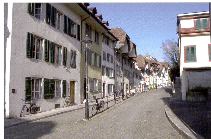
Le Nikon Coolpix P6000 est équipé du processeur d'image Expeed qui traite aussi les données dans les reflex Nikon D3, D700 et D300. Ici aussi, il a fallu sous-exposer légèrement pour récupérer toutes les lumières.

Le P6000 est le premier APN compact Canon à récepteur GPS intégré. Celui-ci enregistre la latitude et la longitude géographique précise du site de prise de vue sous forme de «géomarqueurs», sauvegardés dans les fichiers d'image (EXIF). Grâce à son groupe de lentilles mobiles, le stabilisateur d'image à réduction de vibration limite les effets des mouvements intempestifs de l'appareil et délivre en direct une