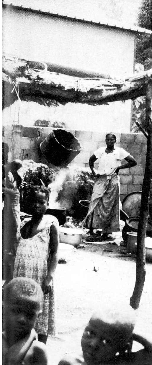
Besuche im Hof bei den Frauen

Probleme und Projektionen auseinanderpflücken muss. Die Gespräche mit meiner Schweizer Freundin helfen mir dabei.