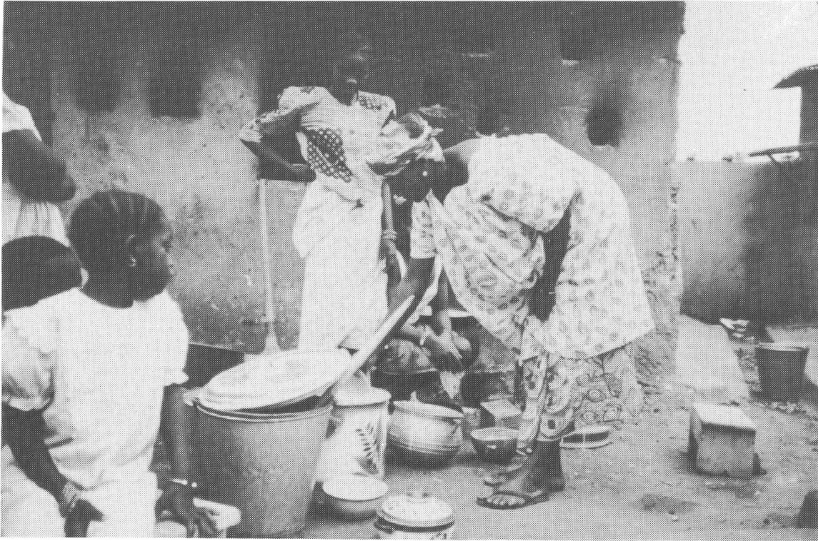
Der halböffentliche Hof.

Die Übertragung des westlichen Gegensatzes zwischen häuslicher und öffentlicher Sphäre und die damit zusammenhängende Geringschätzung von Mutterschaft führt zu Fehleinschätzungen der Lebensbedingungen von Frauen in der sogenannten Dritten Welt. Anhand von Ergebnissen meiner Forschungen in Westafrika möchte ich dies aufzeigen und Überlegungen zur Situation von Frauen in der Schweiz anfügen.