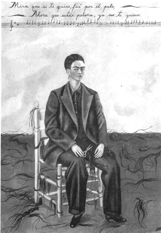
Selbstbildnis mit abgeschnittenem Haar, 1940