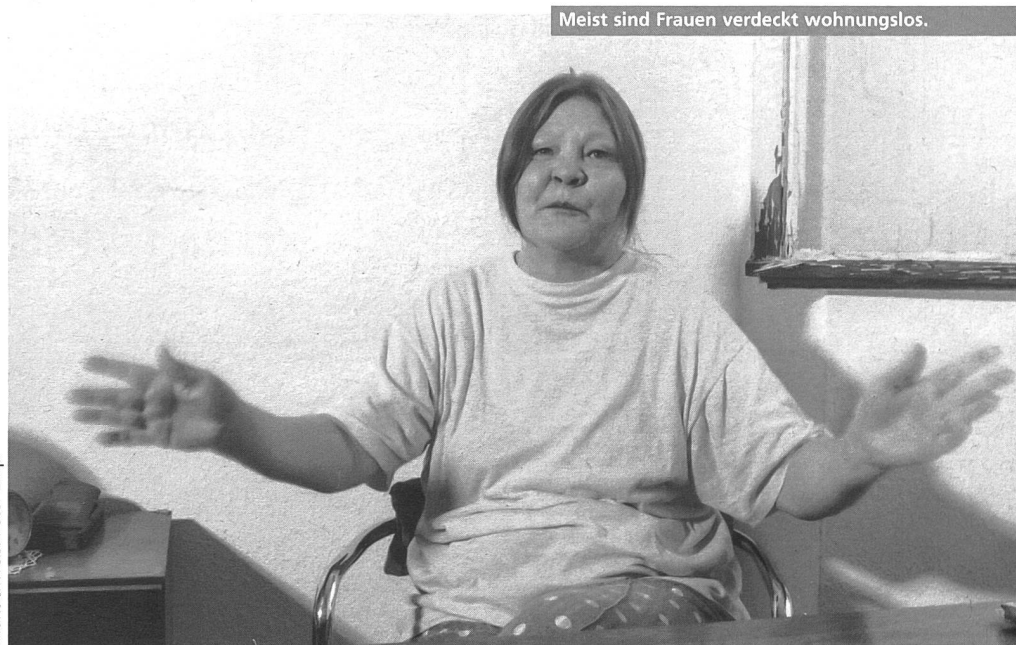
Meist sind Frauen verdeckt wohnungslos.

Wegen ihrer so genannten «häuslichen Bindung» und aufgrund ihrer Benachteiligungen in der unbezahlten Haus- und Familienarbeit sind die biografischen Übergänge im individuellen Lebenslauf von Frauen mit spezifischen Abhängigkeits- und Armutsrisiken belastet. In besonderem Mass gilt dies für Schwangerschaften und die Entscheidung zu einem kontinuierlichen Alltag mit Kind(ern), insbesondere als Alleinerzieherin. Wegen ihrer sozialen Bindungen und Beziehungen, die für sie in der Regel mit materiellen Versorgungsverpflichtungen verbunden sind, können Frauen in beachtliche Abhängigkeiten geraten, nicht nur gegenüber Ehemännern, Partnern, Angehörigen, sondern auch gegenüber Ämtern und Banken. Durch Konflikte und Gewalt in ihrer Herkunftsfamilie oder wenn Ehe oder Partner-