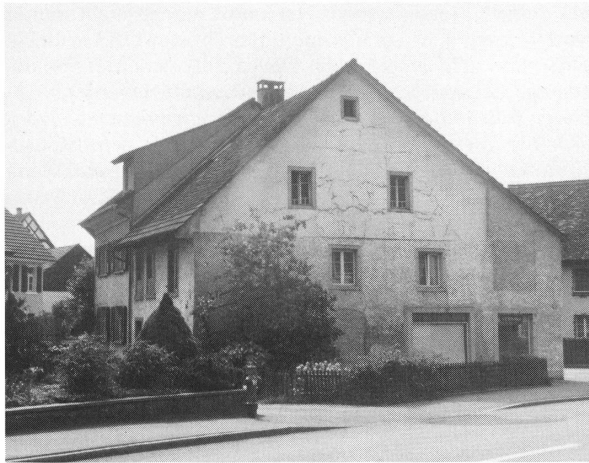
Das Schulhaus 1750 an der Ecke Geissgasse/Hauptstrasse im Sommer 1991 (vgl. Situationsplan 1 Seite 12)

einige Gulden bezahlt für «Haus Zinss da der Schuolmeister noch im Spithal wahre» . Dies dürfte bedeuten, dass die Gemeinde damals auch für die freie Wohnung des Lehrers aufkam, wie dies schon aus der Rechnung von 1711 zu ersehen ist. Wenn immer möglich wurde die Lehrerfamilie in einem gemeindeeigenen Gebäude untergebracht. Während dem Umbau des ersteigerten neuen Schulhauses wohnte die Familie Fuss demnach gleich gegenüber im Spittel. Beim neuen Schulhaus handelte es sich nämlich um das Doppelhaus an der Ecke Geissgasse/Hauptstrasse, das heute unter dem Namen «Insel» bekannt ist, weil vor der Bachkorrektion der Feihalterbach dieses Haus auf drei Seiten umfloss. Sein äusseres