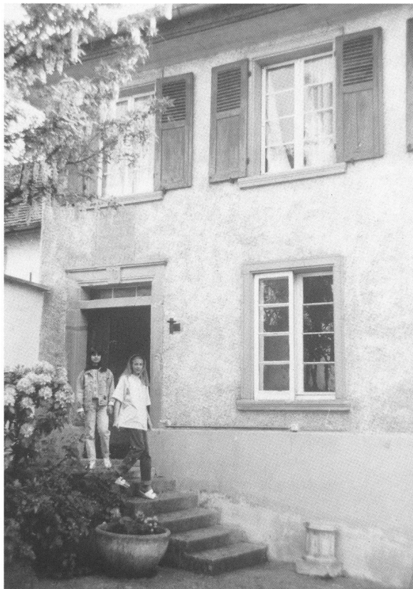
Eingangspartie des Schulhauses 1812 auf dem Rampart (vgl. Situationsplan 2 Seite 12)

Nun ging es aber mit dem Bau des neuen Schulhauses los. Die ersten datierten «Fuhrleute- und Handfröhner» -Listen stammen vom 7. Juli 1812. Anstelle von Steuerzahlungen musste jeder Bürger seinen Anteil an Fronarbeit als Handlanger oder Fuhrmann beitragen. Damit sich keiner drückte, wurde peinlich genau Buch geführt. An besagtem 7. Juli etwa wurden vormittags acht Fuhrleute und 16 «Handfröhner» aufgeboden, von denen elf erschienen. Von den acht Fuhrleuten und 18 Handlangern, die für den Nachmittag aufgeboden waren, schienen alle der Aufforderung gefolgt zu sein. Die Steine für den Mauerbau wurden zum grössten Teil in Ueken geholt, aber auch aus einer «Stein gruben in Stein» . Sand aus der Umgebung wurde herangekarrt, Fuhrleute «auf Sekingen Kalch zu hohlen» geschickt. Mit Fridle Ruffle in Schupfart wurde die Lieferung von rund 200 Quart (1 Quart zu ungefähr 20 Litern) schwarzem und weissem Gips vertraglich vereinbart. Die Tür- und Fenstergewände aus Sandstein mussten in Ittenthal abgeholt werden. Und immer wieder brauchte es Vorspann, um die Steigungen zu überwinden, zum Beispiel «am Kilchrein» . Mehrere Male wurden Fuhrleute ausgeschiedt, um vom «Dirsteinberg Holz zur Schul» zu führen, und am 6. August wurden sechs Gespanne «auf Sekingen Ziegel führen» geschickt, «haben 5000 Ziegel bracht» , die von