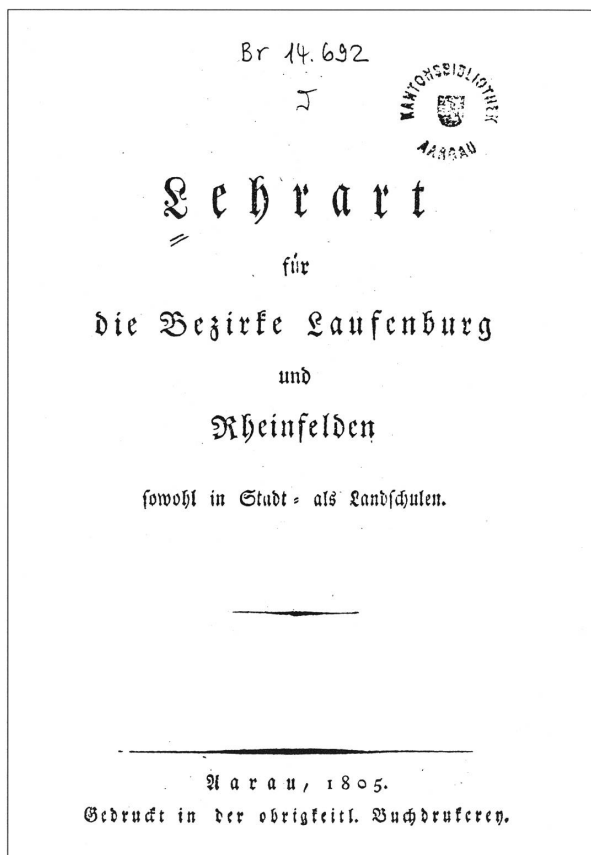
Titelblatt der Schulinstruktion für das Fricktal von 1805