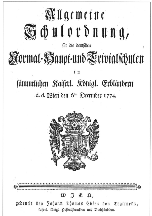
Titelblatt der «Allgemeinen Schulordnung» von 1774