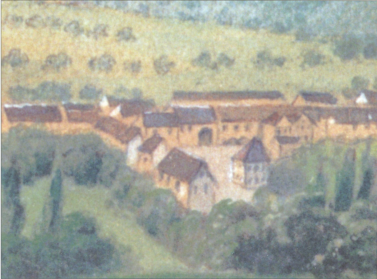
Der Marktplatz (Widenplatz) ums Jahr 1840.