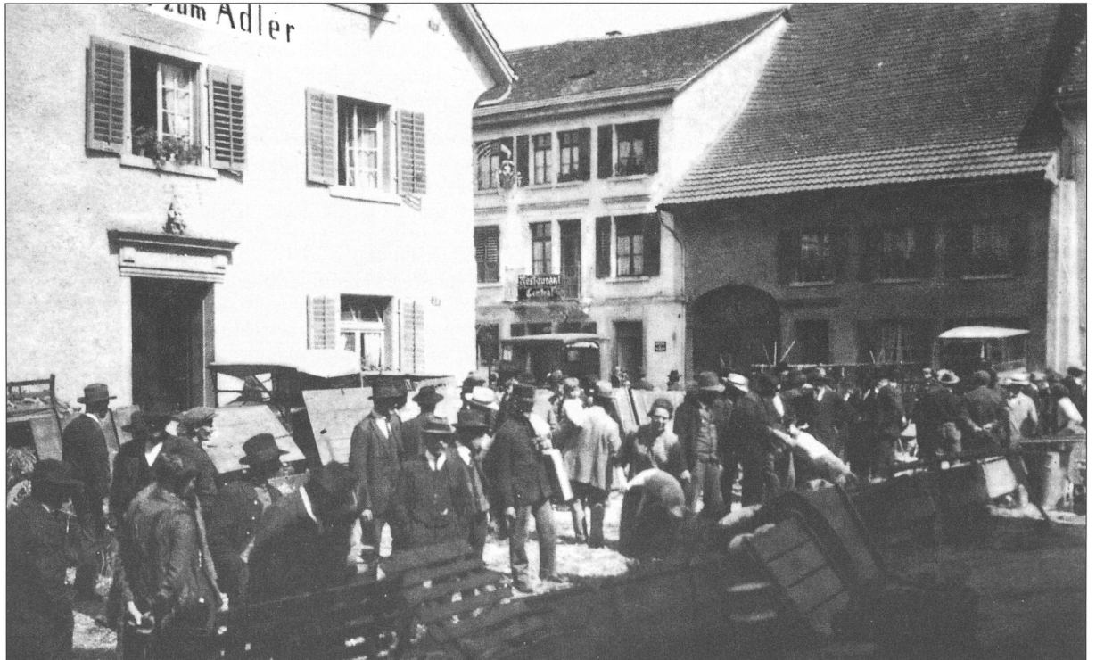
«Säulimärt» beim Gasthaus Adler um 1930.

in der Schweiz machten den Nachholbedarf deutlich. Neue Rassen entstanden, die Leistung sollte um jeden Preis verbessert werden. Dabei gingen allerdings lange nicht alle Rechnungen auf. Doch das ist ein anderes Thema.