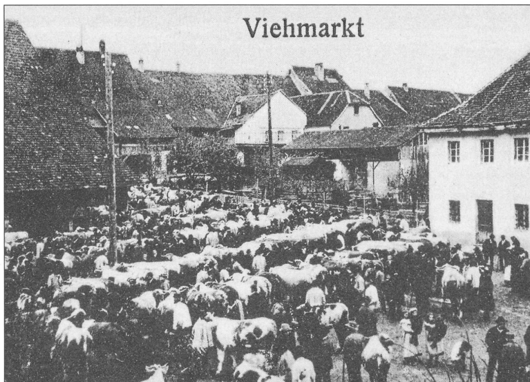
Viehmarkt auf dem Widenplatz (1915).

P: Die Zugkraft stand wohl hoch im Kurs?