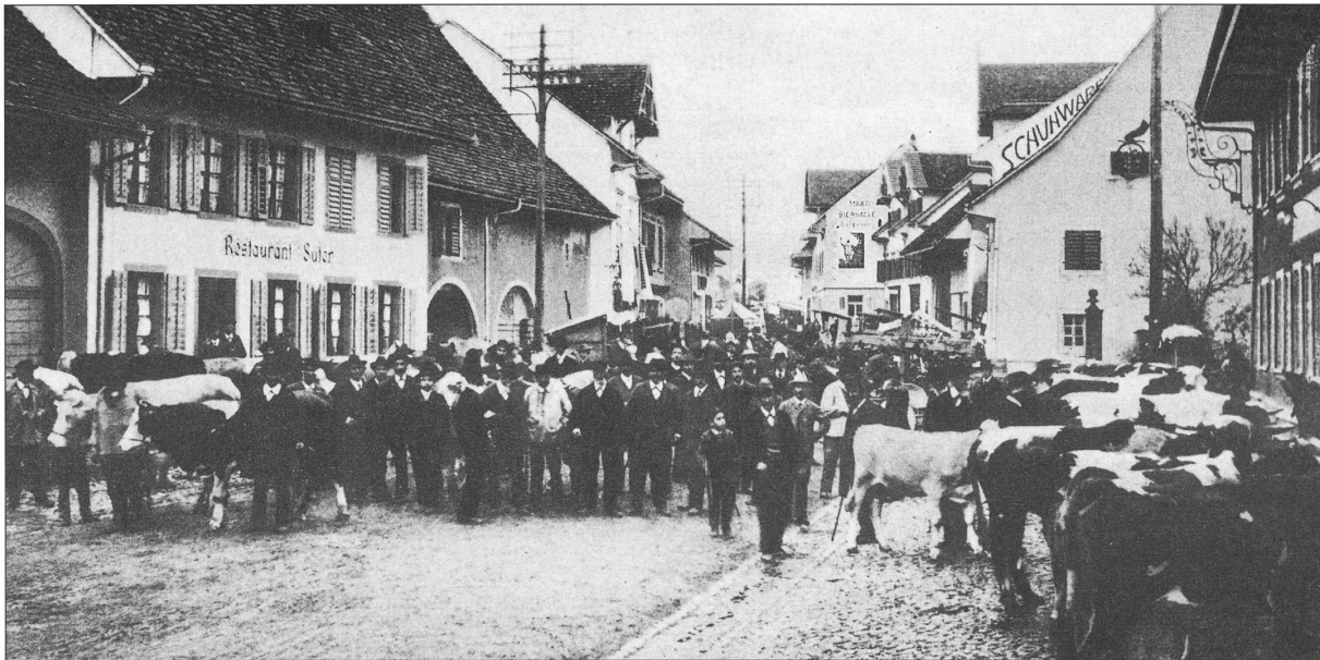
Markttag im Jahr 1913. Der «Bogen» oberhalb des Restaurants Suter (abgebrochen, heute Milchhaus Primo) war Zugang zum Viehmarkt auf dem Widenplatz.

P: Wie viel Grossvieh kam da etwa zusammen?