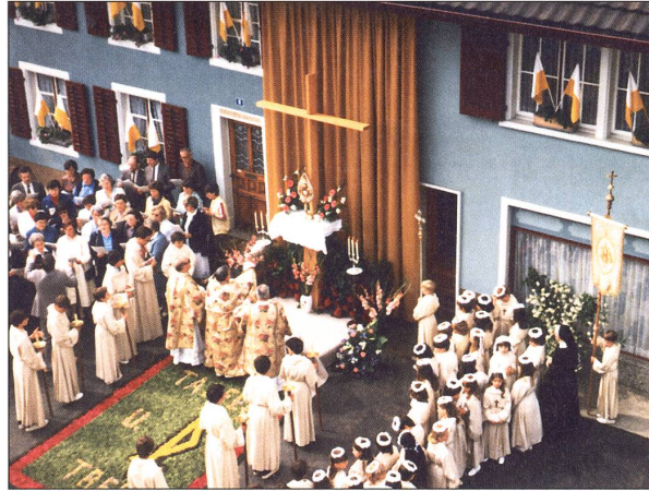
1983: Altar «Welte»: Monstranz auf dem Altar, rechts Erstkommunikanten, in der Mitte Priester und Ministranten, links Kirchenchor.

W: Die Idee verdanke ich meiner Zeit als Pfleger im Spital Laufenburg. Die dort arbeitenden Nonnen erstellten nämlich, einem Brauch ihres Ordens nachlebend, alljährlich zu Fronleichnam einen prächtigen Blütenteppich. Und diese Idee wollte ich in den Aufbau der Fricker