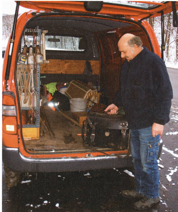
Der einsatzbereite Servicebus mit notwendigem Werkzeug und Ersatzteilen.

I: Unser Wasser ist qualitativ hochwertig und braucht einen Vergleich mit Mineralwasser nicht zu scheuen, dies