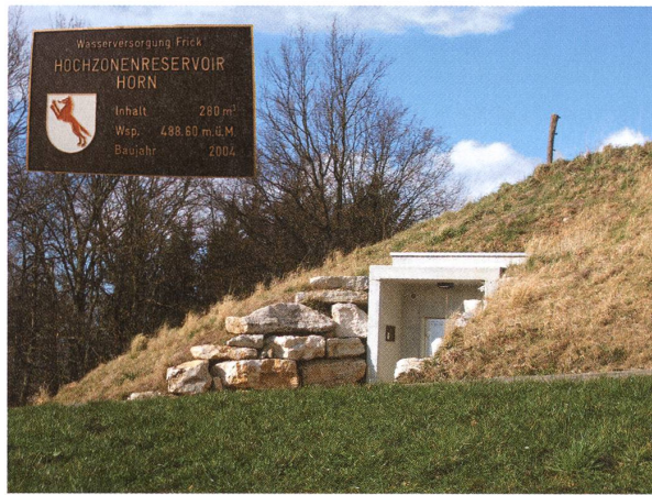
<< Reservoir «Frickberg».