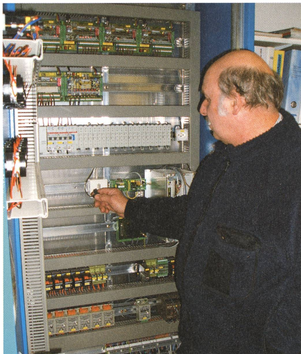
Der Steuerungs- kasten des heutigen Wasserleitungs- systems.

S: Unterstehen Sie einer Weiterbildungspflicht?