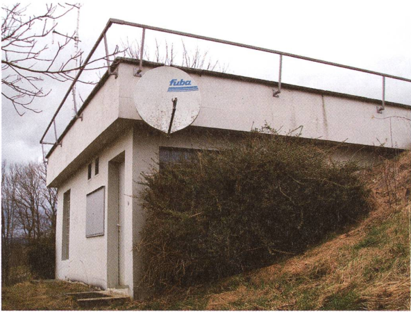
Reservoir «Nessi» im Moos.