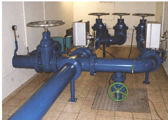
Im Rohrkeller «Neumatt»: zentrale Wasser- verteilung in die Reservoirs und Einspeisung ins Leitungsnetz.

Das Ablesen und Überprüfen der Wasserzähler erledigt das Bauamt.