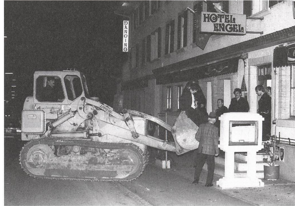
Die Passagiere werden sanft auf der Engeltreppe abgeladen.

Nun begannen die anwesenden Kameraden, allen voran der eben zum Major beförderte Kommandant, mich zu bedrängen und davon zu überzeugen, dieses Baustellen-gefährd mitzunehmen. Nach kurzem Überlegen wurden wir uns einig, mit unserer Errungenschaft zuerst einmal bis zum Hotel Engel zu fahren. Der Kommandant und einige Samariterinnen platzierten sich in der Ladeschaufel. Ich setzte mich in die Führerkabine, und die Fahrt auf der Hauptstrasse Richtung Oberdorf begann. Die unzähligen, verdutzt schauenden Autofahrer, welche die nächtliche Raupentrax-Verschlebung auf der Hauptstrasse miterlebten, wussten scheinbar nicht, dass in Frick wieder einmal Feuerwehr-Endprobe war. Und da musste mit solchem Schabernack gerechnet werden. Nach dieser ratternden Fahrt setzte ich meine Passagiere sanft auf der Engeltreppe ab und parkierte «meinen» Trax auf Käasers Hausplatz gegenüber. Nach längeren Beratungen, was mit solch einem Gefährt wohl noch Sinnvolles angestellt werden könnte, waren wir alle gleicher Meinung: wir