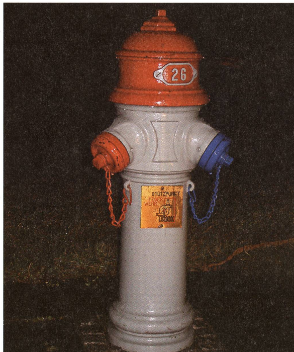
Der «Warmwasser»-Hydrant. Endprobe 2004.

AS: Die Hydrantengeschichte hat sich aus drei Episoden entwickelt. Sie begann, als zwei Feuerwehrkameraden ein neues Eigenheim bauten. Die Erschliessung des Baugebietes erlebten sie von A bis Z mit und konnten mitverfolgen, wie die Wasserleitungen verlegt wurden. Da kamen sie auf die Idee, einen aussergewöhnlichen 1.-Aprilscherz auszuhecken. Kurzerhand kauften sie ein Hydrantenoberteil, den Teil, der aus der Erde ragt. Vom Dorfschmied, ebenfalls einem Mitglied der Feuerwehr, liessen sie eine massive Eisenplatte darunter schrauben. Gelagert wurde der Hydrant im Feuerwehrmagazin. Grau und unansehnlich stand er dort verlassen in einer Ecke. Für Ausbildungszwecke werde er gebraucht, war die ausweichende Antwort, als ich mich mehrmals nach diesem sonderbaren Gegenstand erkundigte.