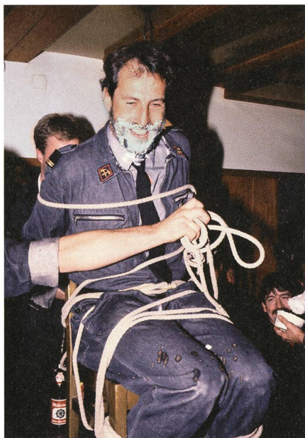
Nach überstandener Rasur wird ein sichtlich erleichterter Pikettchef losgebunden.

nitären Gründen die Augen. Ziemlich beunruhigt begutachtete er aber schon während der Vorbereitungen die bereitliegende Kettensäge äusserst kritisch. Unterdessen hatte ein Feuerwehrmann den Auftrag, schnell die zweite, funktionstüchtige Säge ohne Kette im Büro zu holen und auszutauschen.