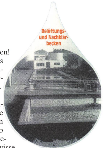
Belüftungs- und Nachklär-becken

Die neue eidgenössische Klärschlammverordnung von 1981 bringt einige verschärfte Vorschriften, verbunden