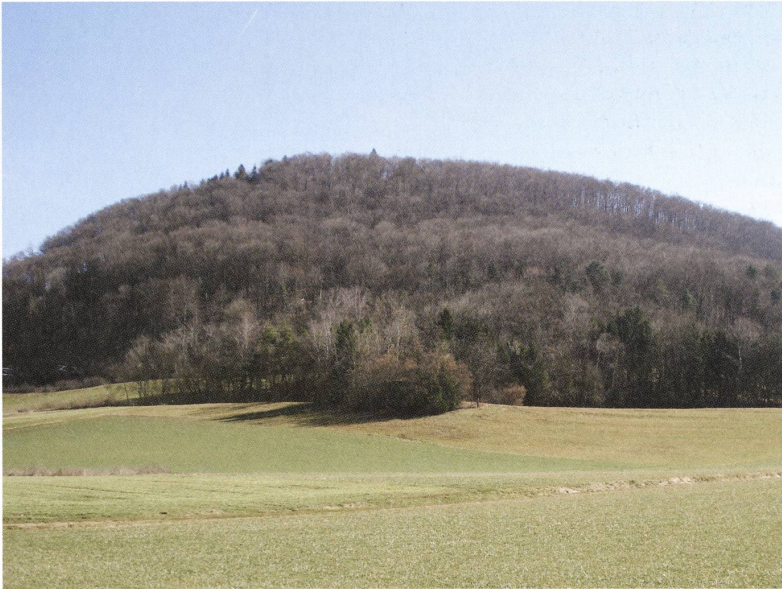
Die Galgenflur zwischen Frick und Hornussen. Auf dem Platz der einstigen Richtstätte steht heute ein durch Gebüsch verdeckter Bunker (Bildmitte).

und Nachkommen nichts Nachteiliges passieren werde. Hierauf haben alle Zimmersleut gesamter Hand die Arbeit ergriffen, fertig gemacht und das Hochgericht aufgestellt. Anschliessend dürfte es, wie es andernorts Brauch war, ein Fest gegeben haben.