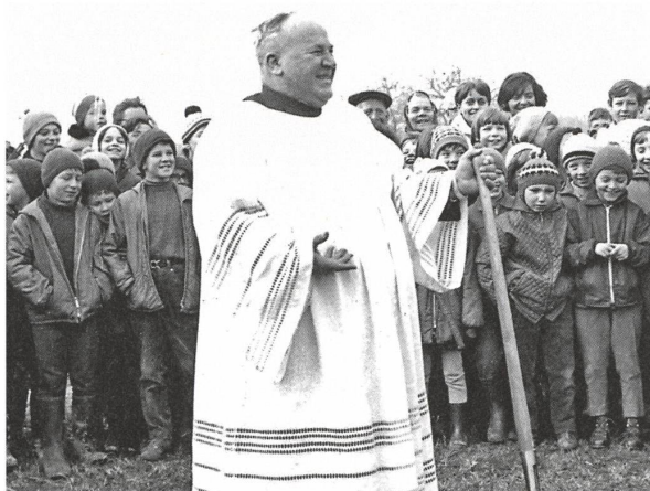
▷▷ Jubiläums- Jodlerabend.