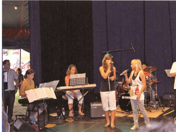
Volle Konzentration der Schülerinnen und Schüler an der Circusshow aus Anlass von «175 Jahre Volksschule Aargau».