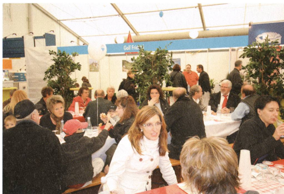
Gastronomie an der Frick Expo 08.