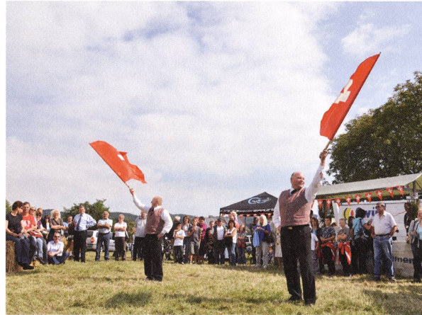
◁ Herbstmarkt und Schweizertag in Frickingen.