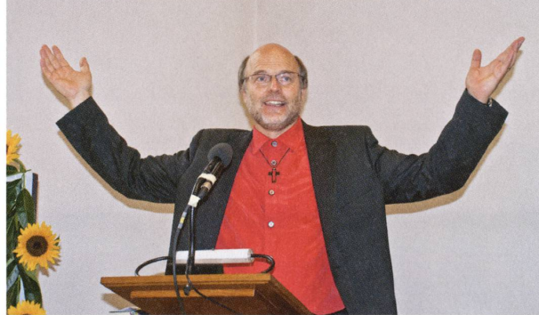
◁◁ Jugendmusik Fricktal.