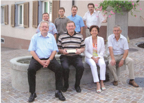
Einweihung des neu gestalteten Brunnenplatzes im Unterdorf.

pflanzt «Tonis Baum», eine Linde, zum runden Geburtstag des Gemeindeammanns.