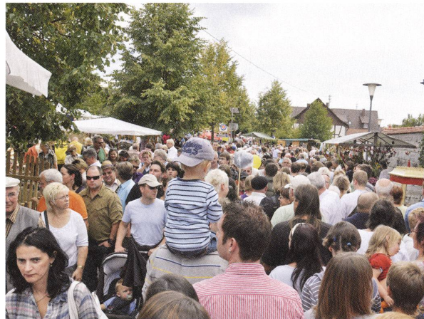
▷ Frickinger und Fricker Gemeinderäte am neuen «Frickinger Platz».