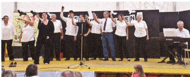
◁◁ Theaterprojekt Konfirmation einst und heute.