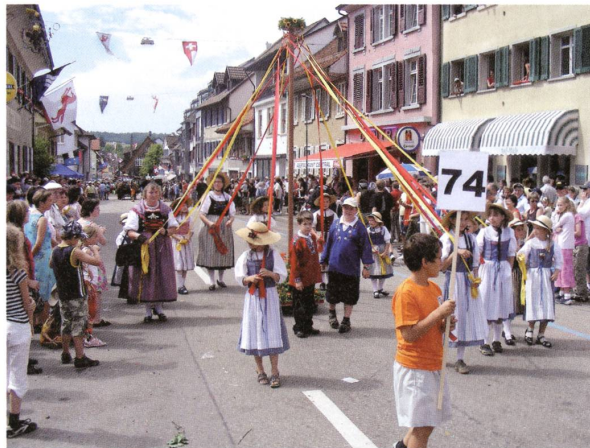
Impressionen vom Jodlerfest.