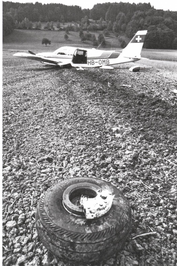
Glücklich überstandene Notlandung im Jahr 1977.

Ich war Mitglied der Motorfluggruppe Zürich. Diese hatte damals etwa 1'000 Mitglieder und eine spezielle Rundflugabteilung. Etwa zwanzig ausgewählte Piloten, welche den Berufspilotenausweis besaßen, gehörten dieser Gruppe an und durften gewerbsmässig Flüge, vor allem Alpenflüge, durchführen. Ziele waren in der Regel Titlis, Tödi, Piz Palü, Matterhorn oder Montblanc. In diesem Rahmen hatte ich den Auftrag, einen Titlis-Flug durchzuführen. Ich startete in Kloten. Nach ungefähr vier bis fünf Minuten hinter dem Albis – ein kurzes Schütteln des Motors; der Propeller stand still. Ich versuchte, den Motor wieder in Gang zu bringen – nichts geschah. Völlige Ruhe an Bord, völlige Stille. Sofort hielt ich Ausschau nach einem Notlandeplatz und machte einen Notruf. Unaufhaltsam sank die Maschine, eine siebenplätzig Piper-Cherokee, bis 10 Meter pro Sekunde, das sind 600 Meter in der Minute! Ein Wäldchen vor dem praktisch einzig möglichen Notlandeplatz entpuppte sich als unüberwindbares Hindernis.