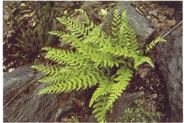
Woodsia polystichoides , Ferner Osten: Sachalin, kult.