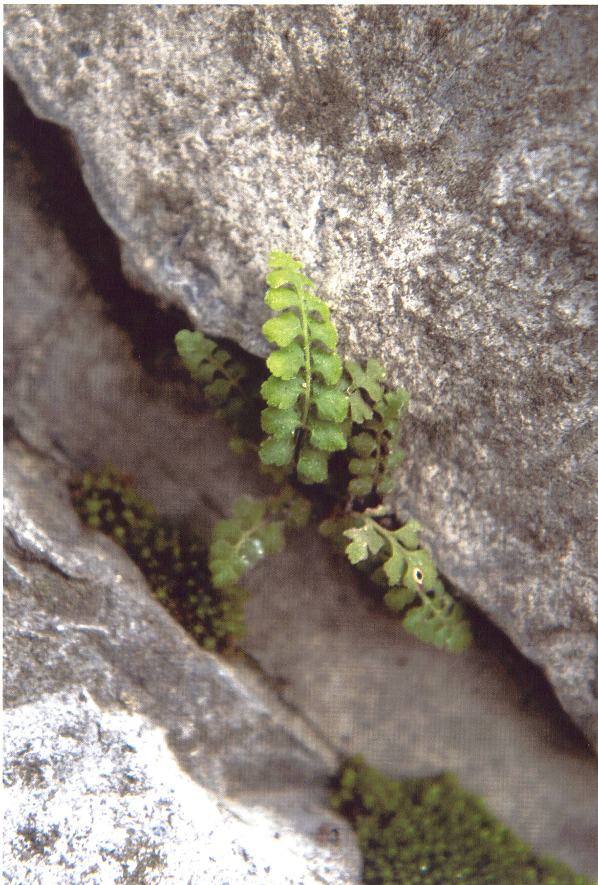
Asplenium petrarchae in Lausanne ist ein ungewohnter Anblick. Diese Art ist eigentlich im mediterranen Klima verbreitet. Die Lausanner Population besteht aus wenigen, dafür sehr vitalen Stöcken.