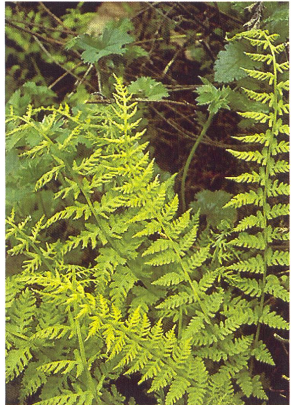
Woodsia fragilis , Kaukasus: Dargew- schlucht; kult.

W. fragilis (TREV.) MOORE: Wedel 20-40 cm lang, länglich-lanzettlich, gefiedert-fiederteilig, dünn und zart, Sori gross, Indusium krugförmig; Kaukasus, en- demisch; lichte bis halbschattige Kalkfelsen bis 2300 m