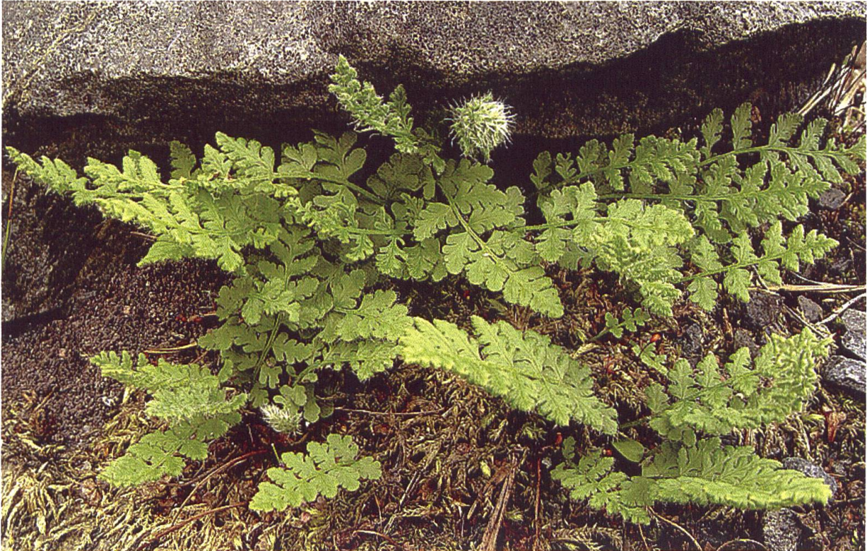
Woodsia ilvensis , Südlicher Wimperfarn, Norwegen; kult.

pulchella (lat. pulchellus = anmutig, schön; wegen der zierlichen Blättchen). Der Artname ilvensis (lat. ilva = Insel Elba) beruht auf einer Verwechslung, da die Art auf der namengebenden Mittelmeerinsel nicht vorkommt. Nach den Internationalen Nomenklaturregeln ist jedoch der Name, unter dem eine Pflanze zuerst gültig beschrieben wurde, beizubehalten, auch wenn er sich als verbal unzutreffend erweist. Auch die Bezeichnung „Südlicher“ Wimperfarn ist irreführend, weil W. ilvensis , selbst wenn