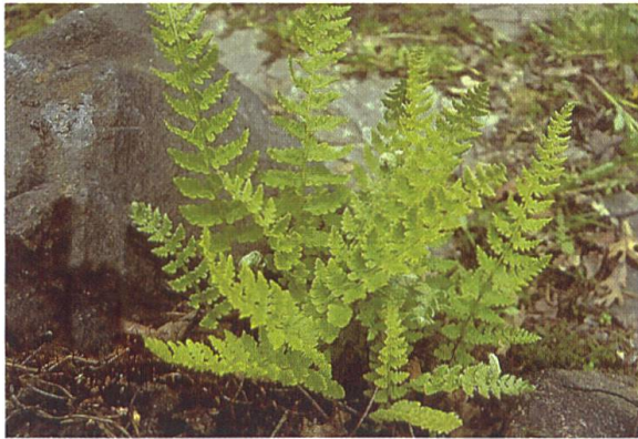
Woodsia subintermedia , Sibirien bei Wladivostok, kult.

S. moschata ), Hauswurz und Donarsbart ( Sempervivum spec. , Jovibarba hirta ), alpine Nelken und Glockenblumen dienen. Zu den beiden Kalkfelsspalten bewohnenden W. glabella -Sippen liegen uns bisher nur negative Kulturerfahrungen vor. Diese zarten und sehr konkurrenzschwachen, noch mehr als W. alpina an arktisch-alpine Verhältnisse angepassten, seltenen Pflanzen werden kaum im Samentausch oder von Spezialgärtnereien angeboten. Die Anzucht von Prothallien aus Sporen gelingt, wie bei den beiden anderen europäischen Arten, recht gut. Jedoch ist die Aufzucht der sehr empfindlichen Sporophyten äusserst problematisch.