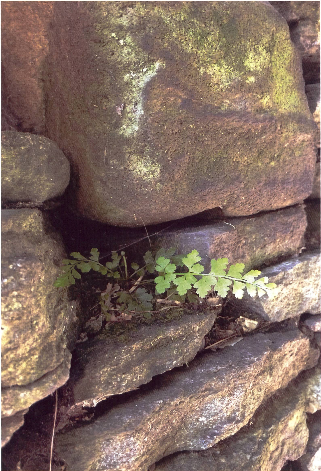
Eine erfreuliche Entdeckung: Dieser junge Asplenium billotii erobert gerade als erster einen neuen Mauerabschnitt.