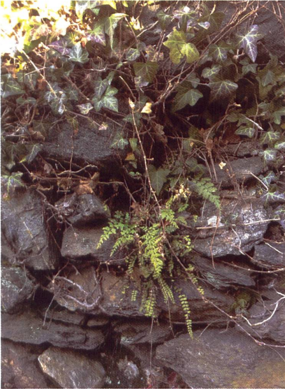
Eine lose geschichtete Trockenmauer mit Erdkontakt bietet vielfältige Farnhabitate.