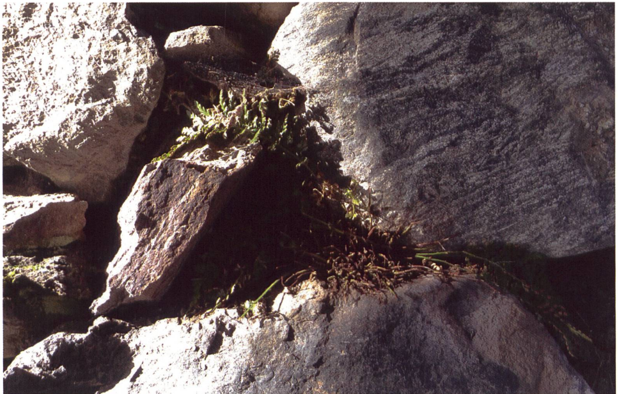
Hier wurden gut zehn Asplenium billotii Opfer eines Fadenmähers. Der Ordnungssinn der Gärtner macht, wohl wegen Unkenntnis, auch vor diesem Farn keinen Halt. Die meisten werden hoffentlich wieder austreiben.