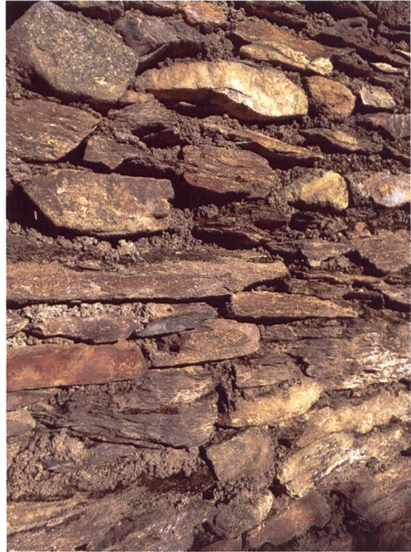
Diese Mauer wurde mit Mörtel für den Asplenium billotii unbewohnbar gemacht.