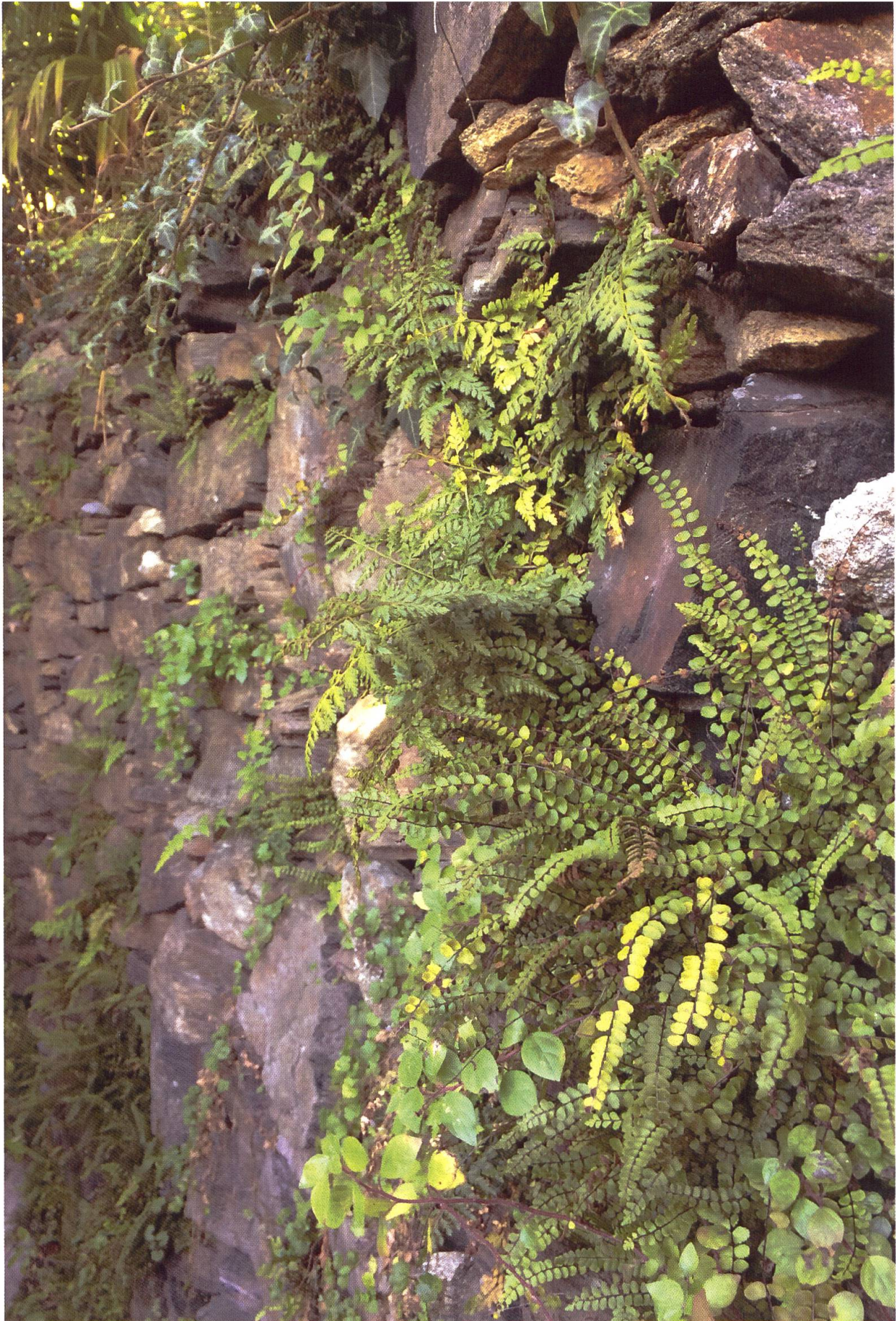
Die nach unseren Kenntnissen aktuell vitalste Population wächst in einer Mauer in einem Privatgarten und besteht aus gut zehn Stöcken in verschiedenen Entwicklungsstadien.