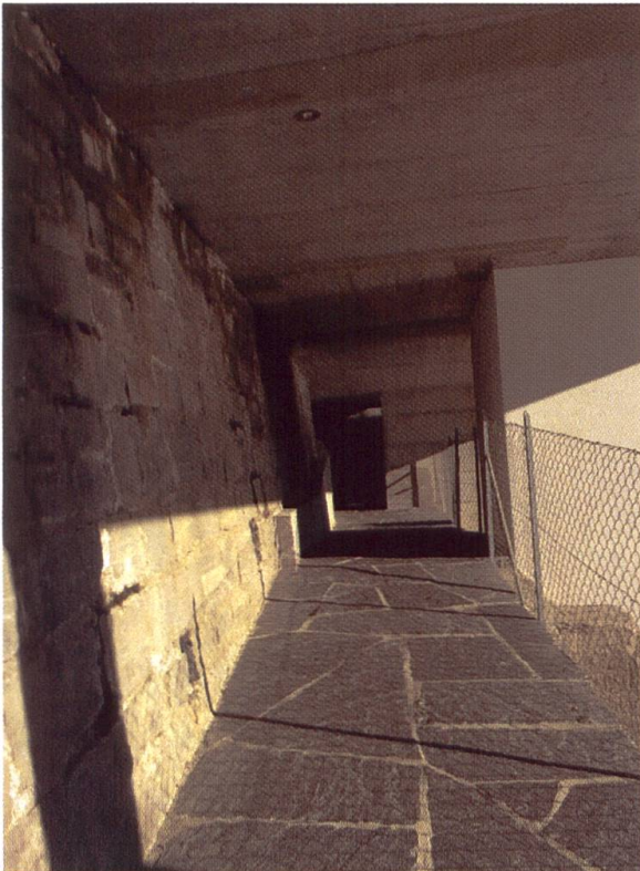
Ein Neubau mit gemauerten Steinwänden. Diese toten Mauern haben keinen Wert für die Farne.