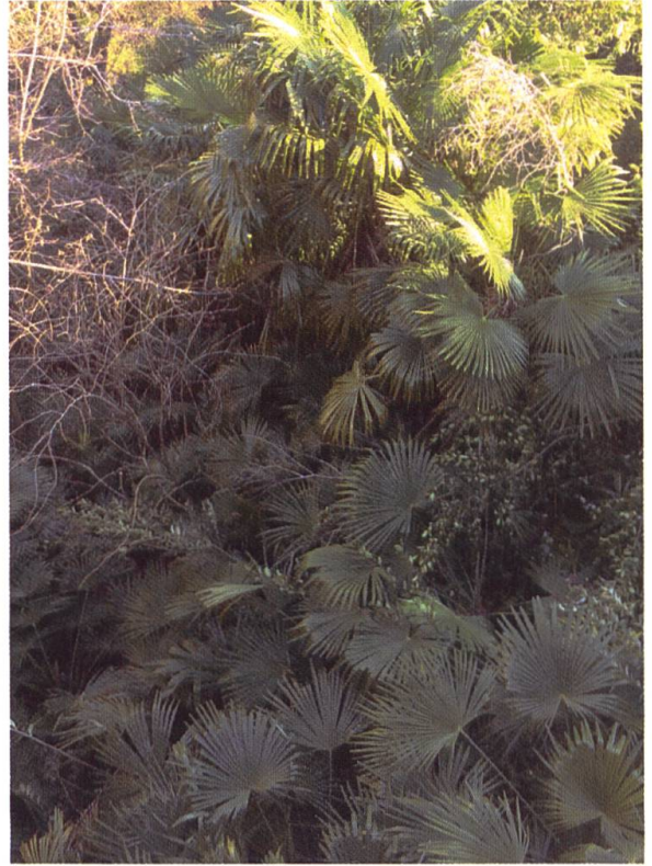
Palmen, Palmen und noch mehr Palmen. Diese immergrünen Neophyten lassen Mauern in der Dunkelheit versinken.