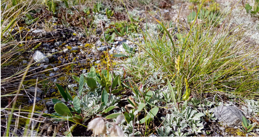
Botrychium sp. A