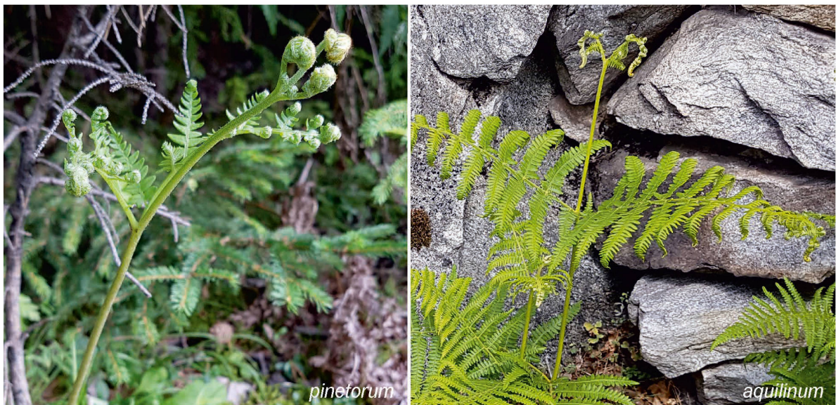
Foto 5: Die entfaltenden Fiedern sind bei subsp. pinetorum aufrecht (mk), bei subsp. aquilinum hängen sie an der Spitze herab. (fr)

Christ, H. (1900) Die Farnkräuter der Schweiz. Beitr. Kryptogamenflora Schweiz, Band 1, Heft 2. Verlag K.J. Wyss, Bern.