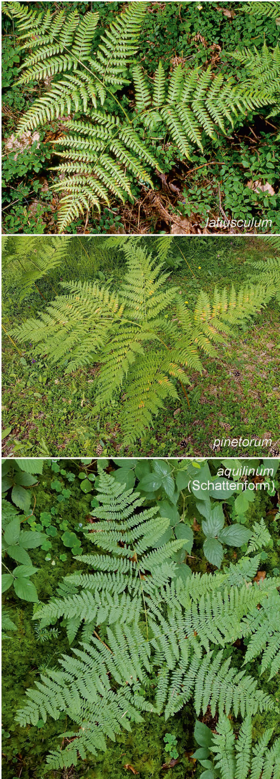
Foto 3: Bei subsp. pinetorum sind die untersten Fiedern meist länger als die darüberliegenden, bei subsp. aquilinum sind sie oft kürzer (mk). Zum Vergleich hier noch P. latiusculum aus Finnland, bei dem die unteren Fiedern sehr gross sind. (rp)