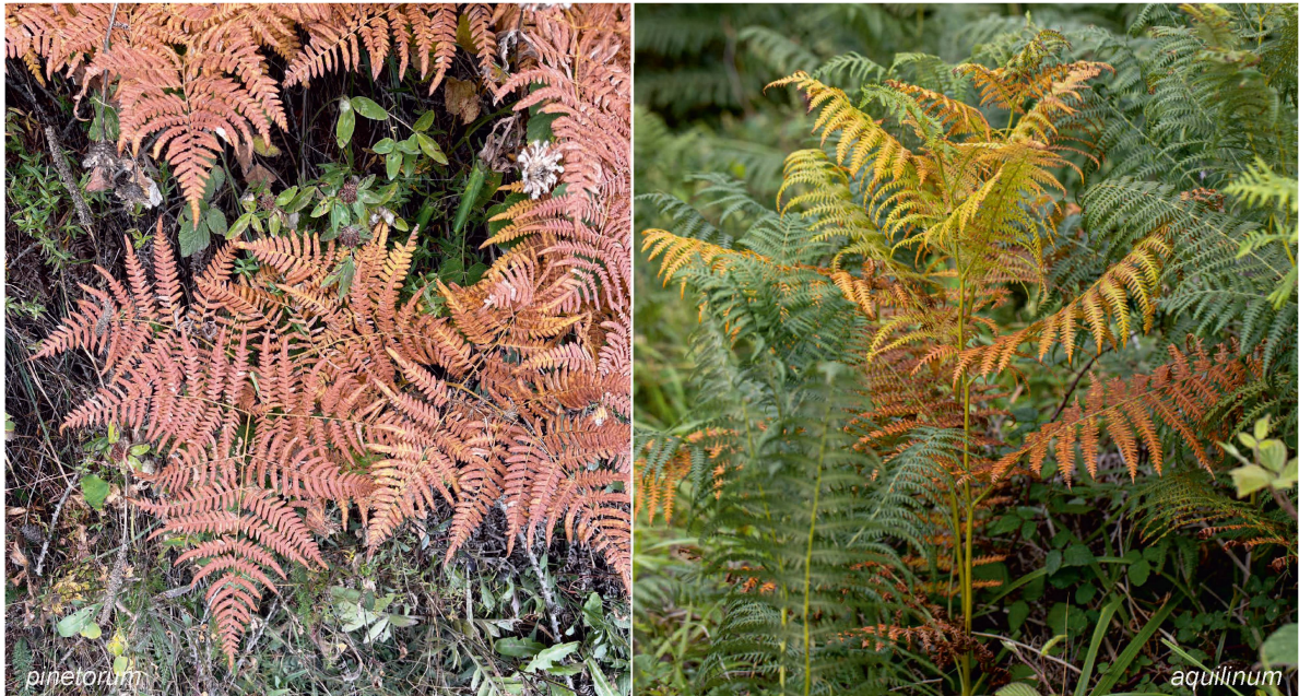
Foto 4: Die Herbstfärbung von subsp. pinetorum ist kupferrot (mv), jene von subsp. aquilinum mehr gelb- bis rotbraun. (fr)