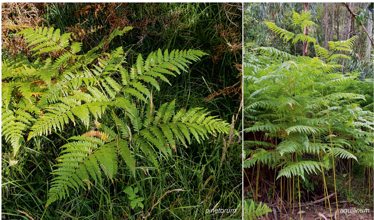
Foto 2: Die Blätter von subsp. pinetorum liegen mehr in einer Ebene als jene von subsp. aquilinum . (mk)