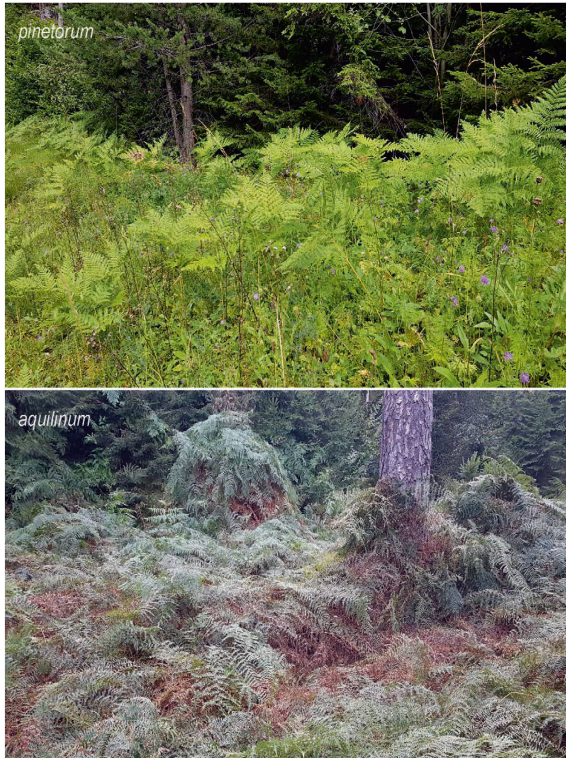
Foto 1: Subsp. pinetorum wird weniger gross als subsp. aquilinum und bildet typischerweise offenere Bestände. (mk)

gebung von Bormio in Norditalien. Ob Christs osmundaceum allerdings tatsächlich subsp. pinetorum entspricht oder lediglich eine kleine, sterile Form von P. aquilinum ist, war bislang umstritten. Seitdem gibt es meines Wissens keine weiteren Fundmeldungen von osmundaceum oder pinetorum aus der Schweiz und InfoFlora führt dieses Taxon nicht auf. Deshalb hatte ich schon länger den Wunsch, den Kiefernwald-Adlerfarn selber in der Schweiz zu suchen und sein Vorkommen in der Schweiz bestätigen zu können.