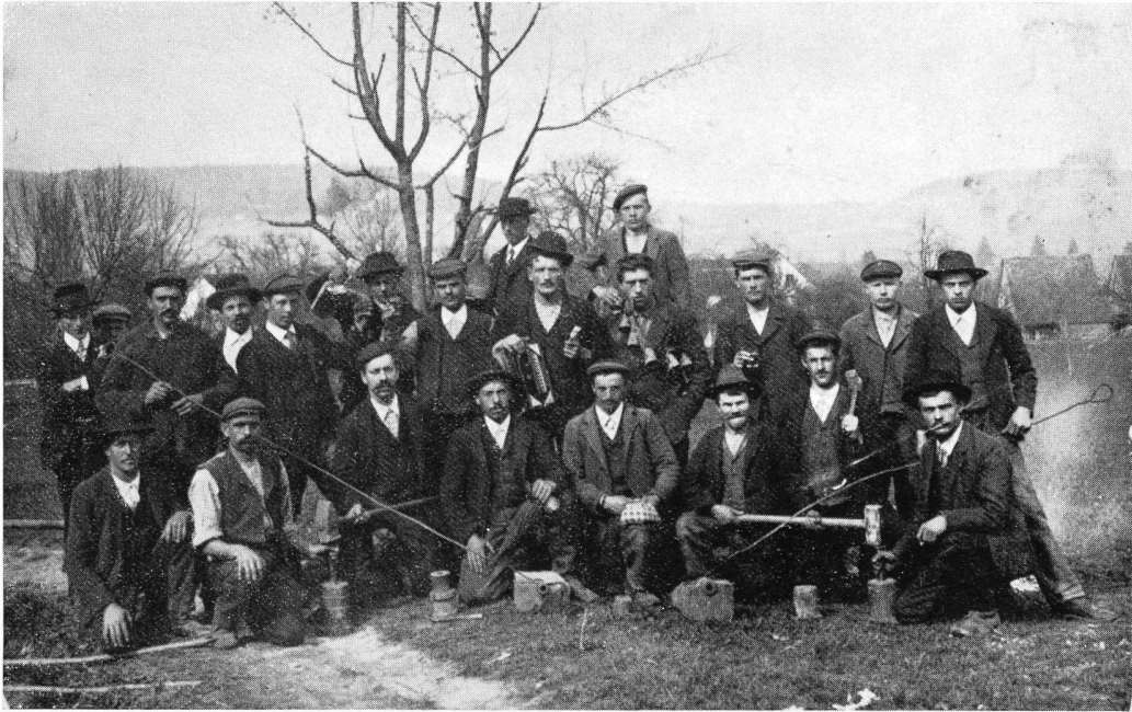
Knabenverein Dällikon ums Jahr 1912 beim Hochzeitsschiessen Man beachte die Utensilien zum Stöpseln und Zünden der Mörser