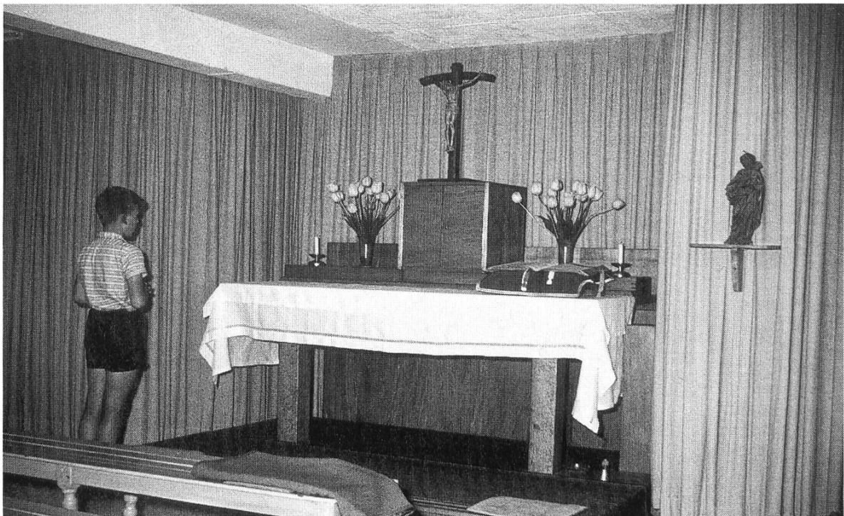
Knabe vor dem Altar: im Keller vom Hubacher 25