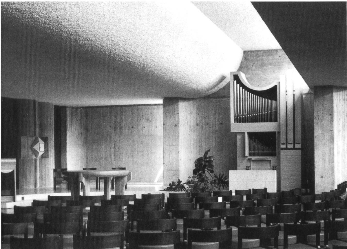
Zum neuen Zentrum, Innenansicht mit Orgel