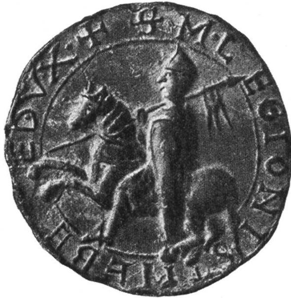
Hl. Mauritius, Führer der Thebäischen Legion, Siegel der Abtei St. Maurice, 13. Jh.

Es bleiben die Fragen: Was meint «über den Berg»? Und mit welchem Berg haben wir es zu tun?