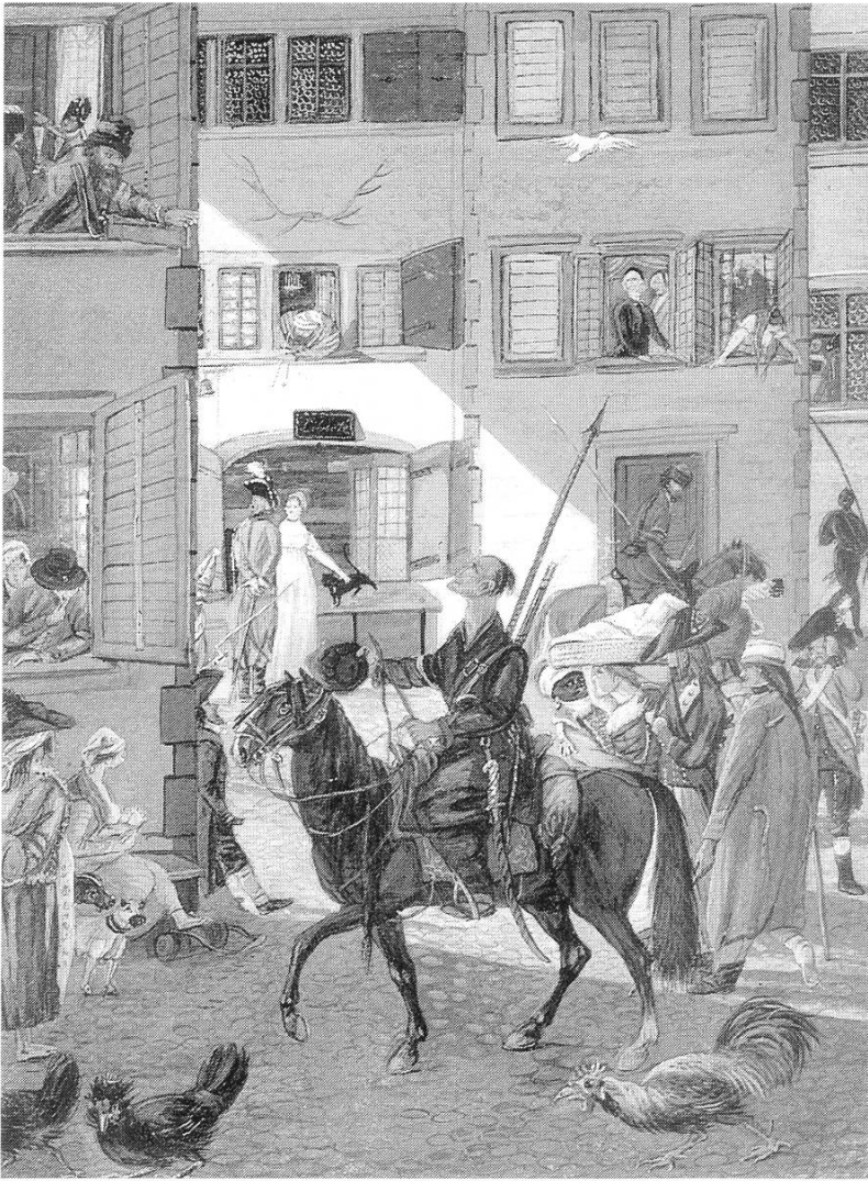
Russische Kosaken in Zürich, 1799