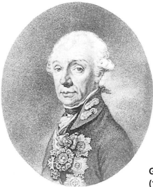
General Alexandr Wassiljewitsch Suworow (1729–1800)

ungeplant via Sisikon über den 2074 Meter hohen Kinzigpass ins Muothatal zu marschieren. Von hier aus wollte er via Schwyz den Angriff auf die Franzosen eröffnen. Aber in Muotathal erreichten ihn weitere Hiobsbotschaften: Masséna sei mit Erfolg über die Limmat vorgestossen, die Armee von Korsakow habe sich aufgelöst, und die Franzosen hätten bereits alle Positionen bezogen, um ihm den Austritt aus den Bergen zu verunmöglichen. Suworow entschloss sich via Pragelpass, Glarus, Kerenzerberg und Rheintal die winterliche Berglandschaft möglichst rasch hinter sich zu bringen. Aber die Franzosen blieben ihm auf den Fersen und versperrten den erschöpften Truppen den Durchgang auch