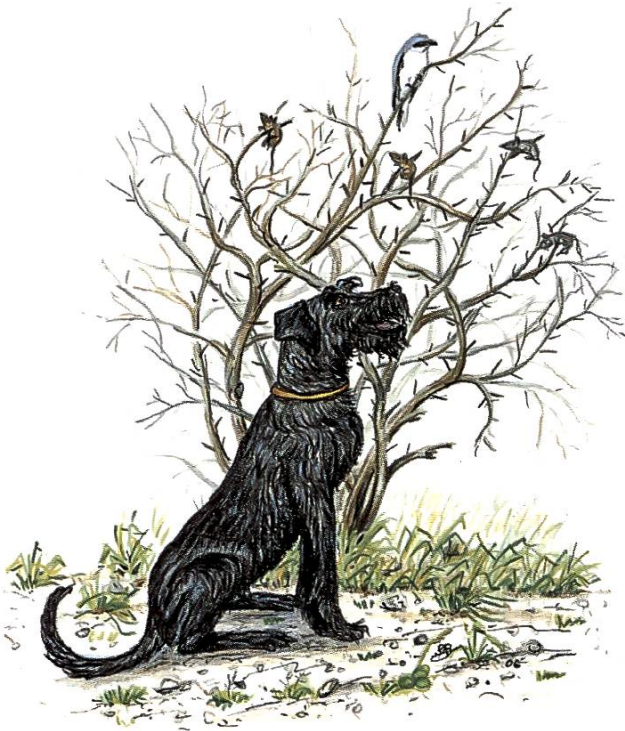
Der Raubwürger spiesst Mäuse als Vorrat auf.

der jeweils die Büsche nach Mäusen absuchte, die er dann selber frass. Mitte der 1940er Jahre wurde dieses Paradies leider nach und nach mit