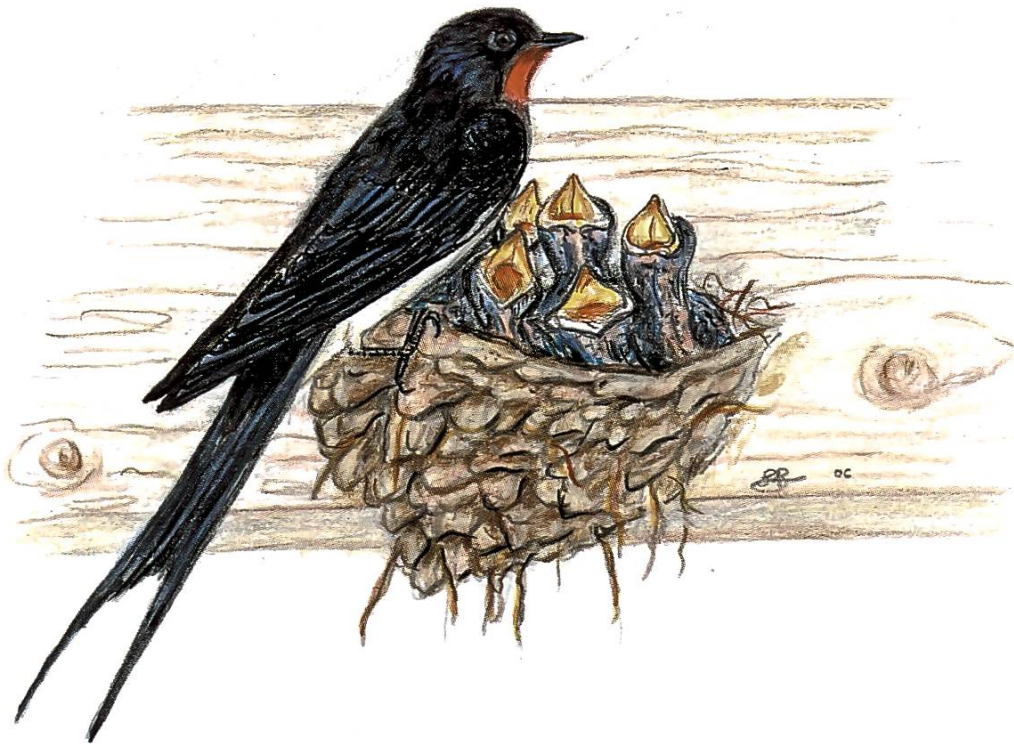
Rauchschnalbe am Nest

mit Kuhställen. Im traditionellen, eher niedrigen Stall brüten jährlich etwa 5–6 Paare, im Freilaufstall in der Regel nur ein Paar. An weiteren ca. 3 Standorten brütet jeweils ein Paar, wenn regelmässig Pferde, Schafe oder weiteres «Kleinvieh» ein geeignetes Mikroklima schaffen. Wo diese Tiere aber oft im Freien sind, brüten auch keine Schwalben mehr im Stall. Der Bruterfolg ist somit auf deutlich weniger als 100 Jungschwalben pro Jahr geschrumpft. Auch in den anderen Untersuchungsgebieten zeigt sich dieselbe Tendenz. Für die Natur, die sich gewohnt ist, dass Veränderungen auf Tausende von Jahren verteilt sind, kann eine solch massive Reduktion innerhalb so kurzer Zeit natürlich nicht ohne Folgen bleiben! Das Untersuchungsprojekt hat bestätigt, dass die Rauchschnalben heute in unserer Klimazone direkt vom Viehbestand abhängig sind.