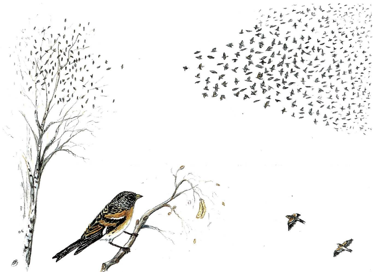
Ein aussergewöhnliches Schauspiel: eine Wolke aus Bergfinken