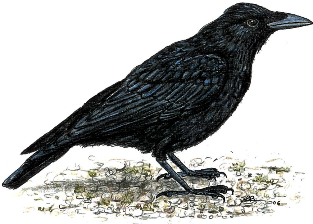
Die Rabenkrähe zählt auch zu den Singvögeln.

Unseren Garten, der mit vielen Sträuchern und Bäumen bewachsen ist, hat sich ein Krähenpaar als Refugium ausgesucht. Falls sich andere Schwarzröcke dem Anwesen nähern, werden sie lauthals davongejagt. Mein Tun und Lassen auf dem Hof scheint das Paar zu interessieren: Kaum erblicken sie mich, kommen sie angeflogen, setzen sich ganz in der Nähe auf einen Ast und krähen um die Wette. Täglich spaziere ich mit meinem Hund dem Furtbach entlang, der unweit unseres Anwesens vorbeifliesst. Kaum mache ich mich auf den Weg, folgt mir das Krähenpaar. Beachte ich sie nicht, fliegen sie ganz nah an meinem Kopf vorbei und setzen sich in der Nähe auf einen Baum. Hin und wieder lasse ich ein Hundeguezli fallen, und keines entgeht ihnen. Erstaunlich ist, dass sie sich nur etwa 300 Meter vom Anwesen entfernen. Sobald mein Spaziergang weiter führt, fliegen sie zurück und erwarten dort meine Rückkehr. Wenn sie mich dann kommen sehen, fliegen sie mir entgegen, und wir treten zusammen den Rückweg an.