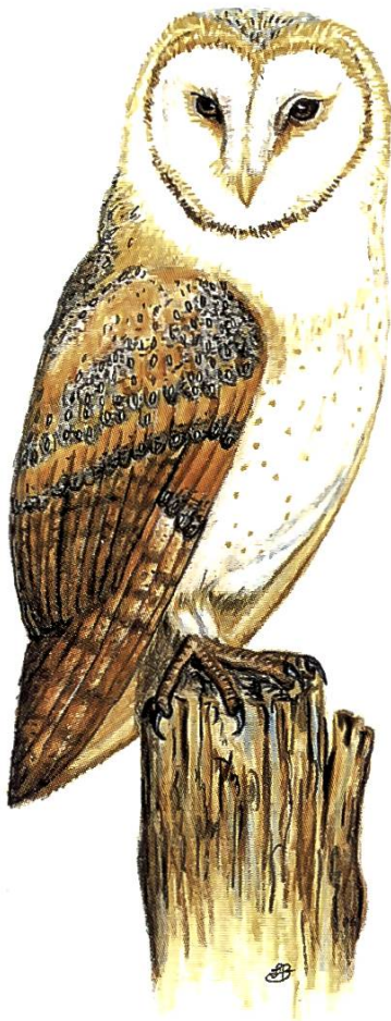
Schleiereule, ein heimlicher Jäger

Wenige Jahre nach dem Bau unseres Hofes im Jahre 1993 fanden wir an verschiedenen Orten Kotspuren eines uns unbekanntes Tieres, und ab und zu sahen wir nachts einen grossen Vogel davonfliegen. Nach einiger Zeit entdeckten wir am späten Abend eine Schleiereule auf einem Balken hoch oben unter dem