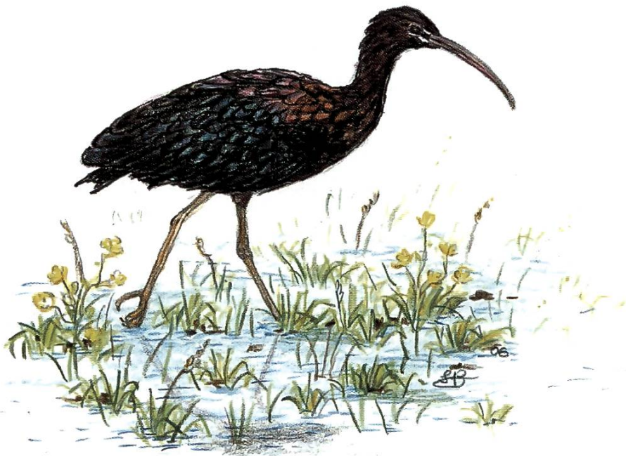
Der Sichler, ein Irrgast

Im Oktober 2004 entdeckte ich auf einem Feld nördlich des Kieswerks Regensdorf einen von mir in der Schweiz noch nie gesehenen braunen Schreitvogel mit langem, gebogenem Schnabel. Ich konnte ihn sehr gut beobachten, da seine Fluchtdistanz gering war. Nach meinem Vogelbestimmungsbuch zu schliessen handelte es sich dabei um einen Sichler.