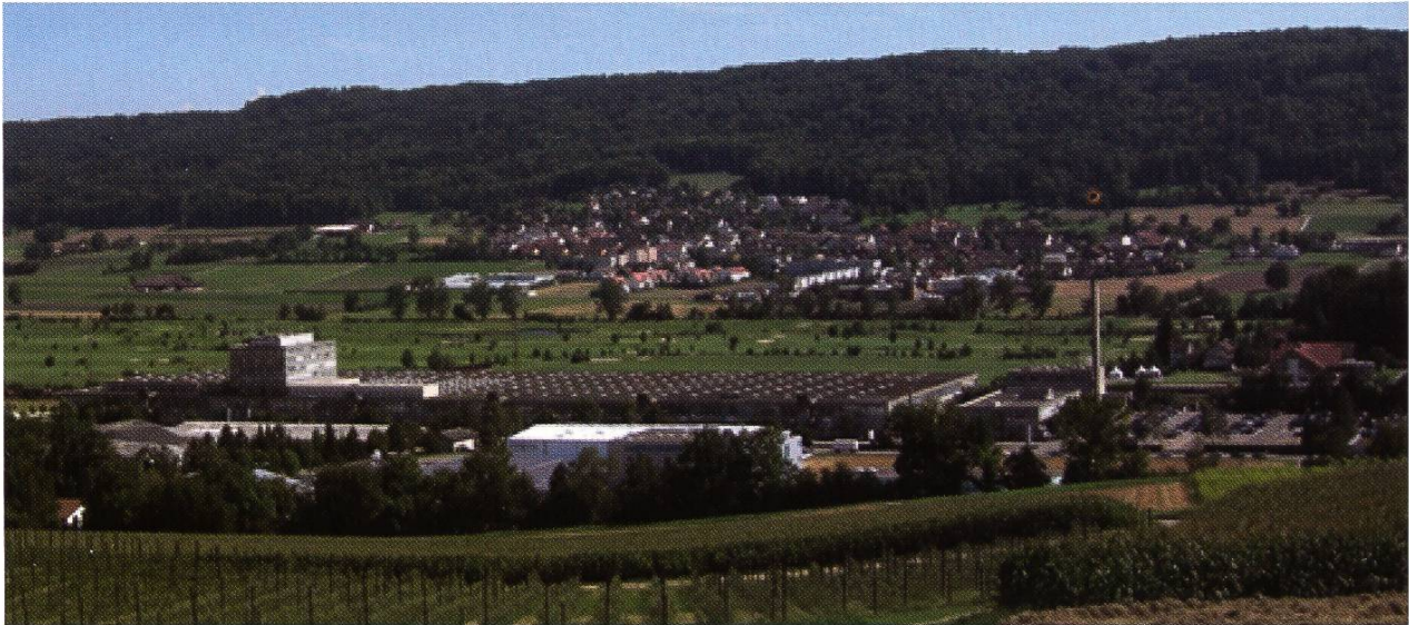
Jelmoli-Baukomplex von oben, 2007

würde. Dagegen wird die differenzierte Bauweise mit Hochhaus innerhalb des engeren Orts- bzw. Quartierbildes eine architektonisch-städtebaulich bessere Lösung als eine herkömmliche Bauart ermöglichen. Damit kann aber das Erfordernis der guten Eingliederung eines Hochhauses ins Landschaftsbild, insofern bei Bauten in einer Industriezone überhaupt davon gesprochen werden kann, als erfüllt bezeichnet werden».