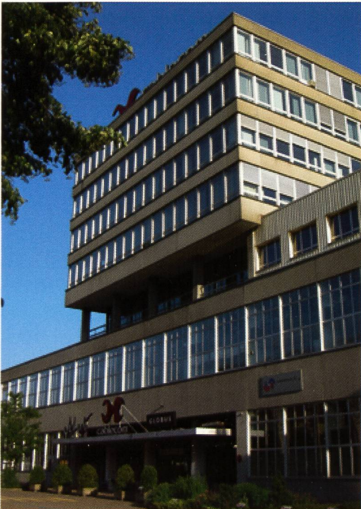
Jelmoli-Bürohaus, von Nordwesten, 2007

Da die Jelmoli SA in Otelfingen primär ein Lagerhaus und nicht einen Repräsentationsbau erstellen liess, hielt es die Bauherrschaft für «ausserordentlich wichtig [...], darauf hinzuweisen, dass bei der Projektierung, bei der Wahl der Bauart, bei der Wahl der Baumittel, bei der Wahl der technischen Geräte,