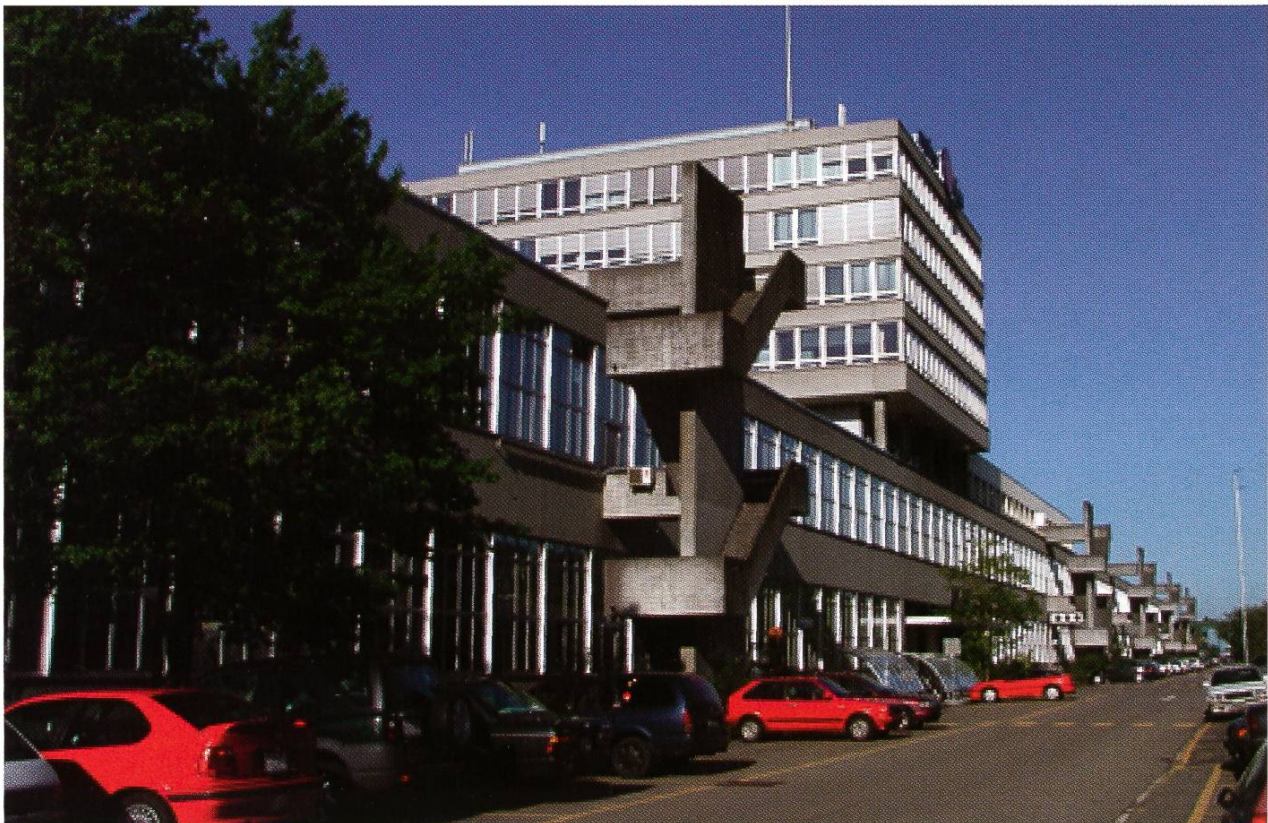
Nordflanke Jelvoli-Lager- und Bürohaus, von Osten, 2002

Die Nordflanke des Lagerhauses aber wertete Rohn als Schauseite für den von Nordwesten herkommenden Besucher auf, der das im hinteren Drittel bündig aufgesetzte Prisma des Bürohauses mit seiner hier befindlichen Eingangspartie als kraftvolles Gegengewicht wahrnimmt. Es hätte allerdings, wären die Pläne Rohns verwirklicht worden, noch viel eindrücklicher werden sollen. Die lange Fläche der Lagerhausfassade löste Rohn durch zwei hohe Bänder mit endlos aneinandergereihten Fenstern auf, jedes in zehn Felder gegliedert. Das wechselnde Tageslicht bringt die Glasfenster und ihre Rasterung zu ganz unterschiedlicher kräftiger Wirkung, ebenso die repetitiven vertikalen Rahmenteile aus Aluminium. Weil der Rahmung keine tragende Funktion zukommt – diese übernehmen Betonpfeiler im Innern – unterbricht sie die endlose Reihung der Fenster nur wenig stärker als die Fensterraster. Die durchgezogenen Brüstungen aus vorgehängten Betonplatten zwischen den beiden Fensterreihen und als obere und untere Fassadenbegrenzung bilden dazu eine kompakte ruhige Horizontale.