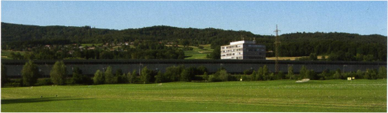
Jelmoli-Lager- und Bürohaus, Südseite, 2007

zu einem Chemisch-Reinigungsgeschäft. Wie andere typische Warenhäuser wurden auch die Jelmoli SA zunehmend durch die aufkommenden Supermärkte und Discounter auf der einen und die Boutiquen auf der anderen Seite bedrängt. Mit der Gründung der Jelmoli Holding AG und der Uebernahme einer Fachhandelskette für Elektrogeräte, der Dipl. Ing. Fust AG, suchte sich die Jelmoli 1994 neu zu positionieren.