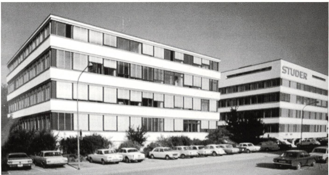
Studer Revox AG-Gebäude Althardstrasse 146 und 150, Regensdorf

In der Zeitspanne der expansiven Entwicklung ab Mitte der 60er Jahre fiel 1967 die Errichtung des zweiten Fabrikations- und Verwaltungsgebäudes an