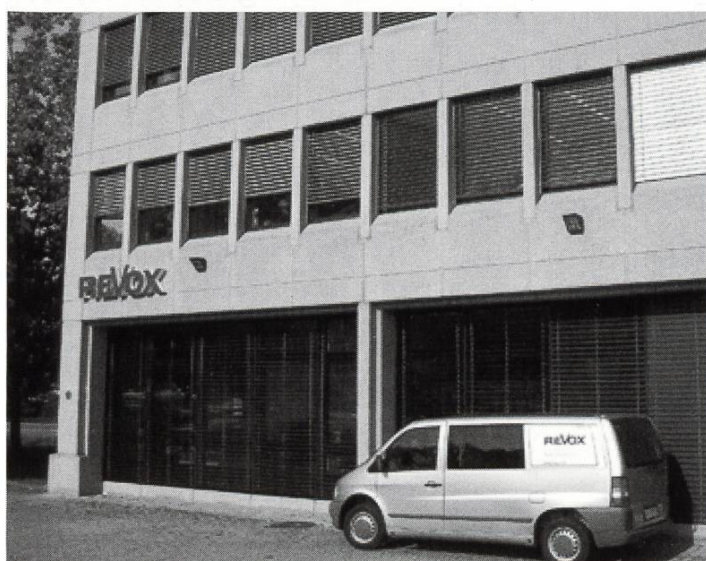
Revox AG Regensdorf, 2007

Revox hat einige Wirren hinter sich. Die Produktion in der Schweiz wurde nach und nach geschlossen. Der Hauptsitz wurde zwischenzeitlich sogar von Regensdorf nach Wollerau verlegt. Alle deutschen Produktionsstätten der Revox in Löffingen, Bonndorf, Ewatingen und Säckingen wurden geschlossen und die Restproduktion nach Villingen verlegt. Dort befindet sich heute die Entwicklung und Produktion der heutigen Geräte. Solange noch Leute mit entsprechender Erfahrung vorhanden sind, repariert der Werkservice alle noch existierenden Revoxgeräte.