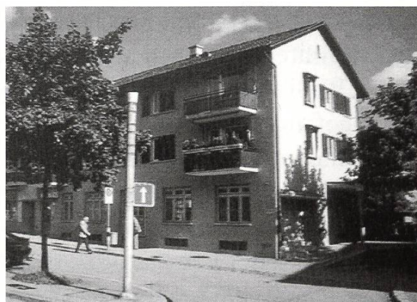
Studer-Gebäude Wehntalerstrasse 294, Zürich-Affoltern

Bereits im September konnte Willi Studer die bestellten Hochspannungsozillographen ausliefern und von Emil Häfely einen Nachfolgeauftrag zum Bau von zehn weiteren Apparaten entgegennehmen. Der Start in die unternehmerische Selbständigkeit war geglückt und der erste Schritt auf dem Weg in eine vielversprechende Zukunft zurückgelegt.