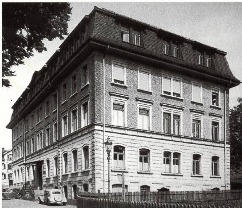
Metrohm AG, Herisau