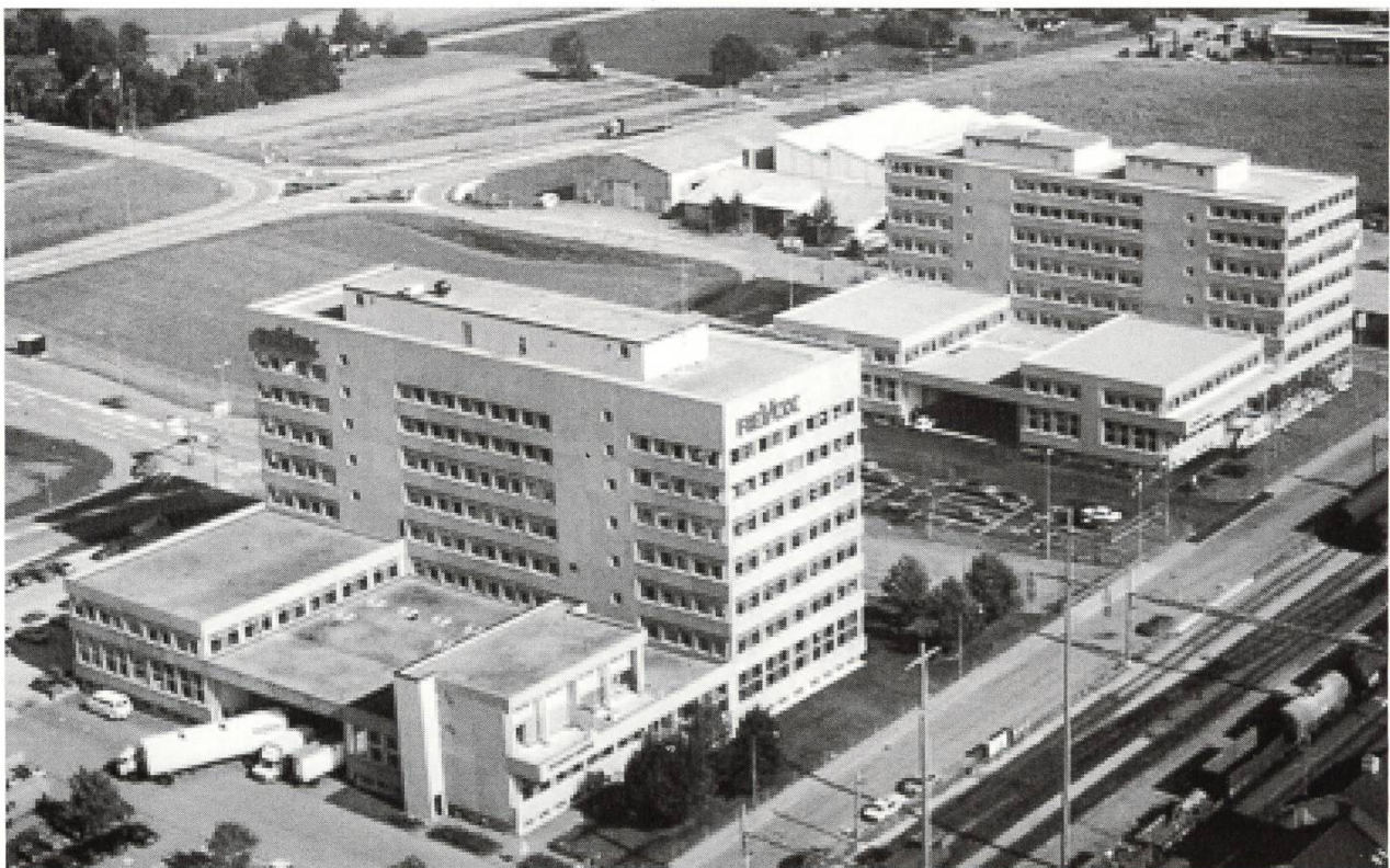
Studer-Werke Althardstrasse 10 und 30, Regensdorf

Die politische Situation wurde in der Schweiz nach 1970 schwierig, sodass sich Willi Studer und seine engsten Leute ernsthaft um den Weiterbestand der schweizerischen Aktivitäten sorgten. Bei Annahme der Schwarzenbach-Initiative hätte die Anzahl der ausländischen Mitarbeiterinnen und Mitarbeiter um einen Drittel gekürzt werden müssen, was die Schliessung der meisten Abteilungen zur Folge gehabt hätte. Glücklicherweise wurde diese Initiative im Oktober 1974 vom Volk verworfen. Deshalb wurde einen Monat danach mit dem Bau des neuen, bis dahin grössten Bauvorhabens, dem neuen Fabrik- und Verwaltungszentrum an der Althardstrasse 30 in Regensdorf begonnen. Nach achtzehnmonatiger Bauzeit konnte im Juni 1976 der neue, repräsentative Sitz des Stammhauses an der Althardstrasse 30 in Regensdorf bezogen werden. Nebst der Automation und Verwaltung wurde die eigentliche Produktion für professionelle Maschinen und der Studiobau sowie die Forschung und Entwicklung untergebracht. Der Umzug aus den dazugemieteten Räumlichkeiten an der Althardstrasse 158 und 185 sowie die Produktion aus den Gebäuden Althardstrasse 146 und 150 wurden in wenigen Monaten vollzogen und die eigenen Gebäude renoviert und neu durch die Revox ELA AG und die Studer International AG bezogen.