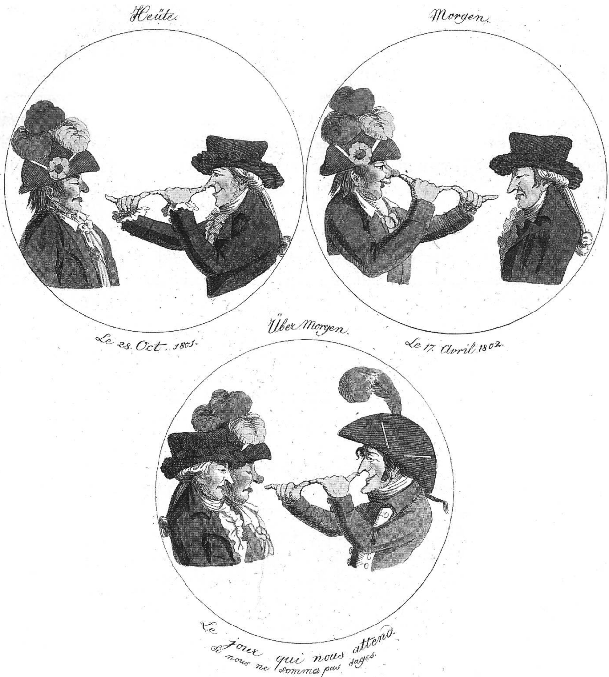
Bild 7 Karikatur um 1802. 1801 zeigt der Aristokrat dem Bürger die lange Nase, 1802 ist es umgekehrt und zukünftig wird es Napoleon sein, der vom Streit zwischen den Schweizern profitiert.