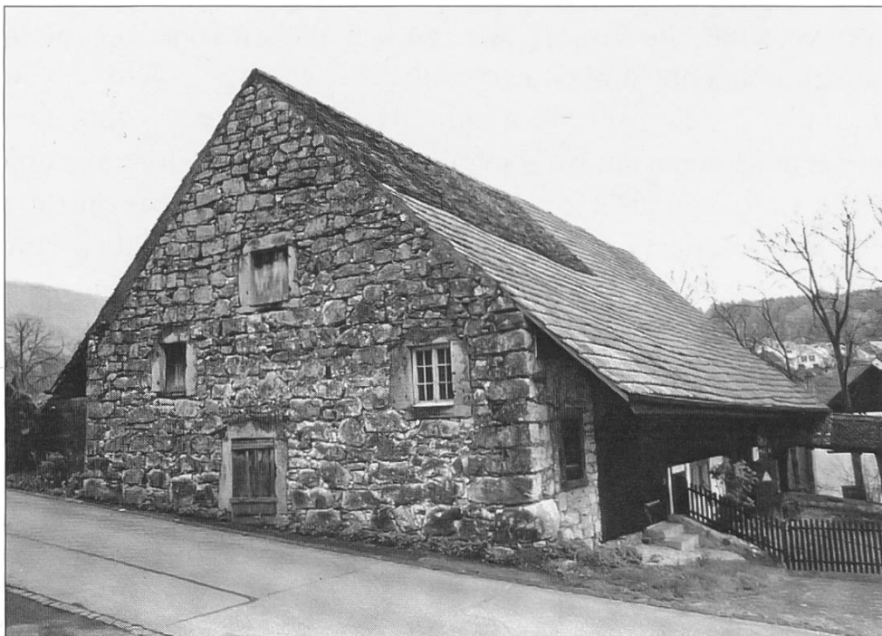
Bild 21: Westansicht Scheune mit wetterfestem Massivmauerwerk, 2001

Es liegt nordwestlich der Mühle und ist durch einen überdachten Zugang mit ihr verbunden. Die Grundfläche beträgt ca 20,3/21,5 x 10,5 m, die Westwand ist etwas abgeschrägt (siehe Bild 21). Der Bau ist durch die Restaurierung von 1969 im Innern nur wenig verändert worden. Wohl einige Jahre vorher hat der letzte Müller Dach, Türen und teilweise auch die Fenster erneuert. Das Gebäude bot sich bis etwa 1960 sehr altertümlich dar, so wie es im frühen 18. Jh. entstanden war. Die Räumlichkeiten dienen heute der Stiftung und den Mietern als Abstellräume.