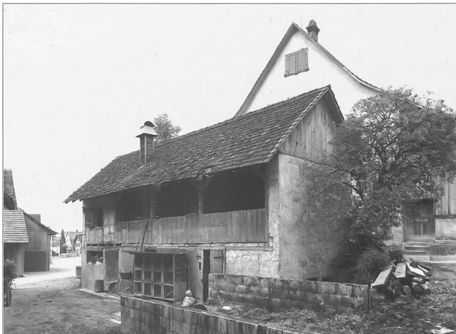
Bild 22: Nebenhaus vor Umbau, als Schweine- und Hühnerstall sowie Abort genutzt, Aufnahme 1964

Dieses Oekonomiegebäude dürfte kaum älter als 150 Jahre sein. Vor 1968 wurde im Erdgeschoss eine Schweinemästerei betrieben, ferner befand sich hier auch der einzige Abort für die ganze Mühle (siehe Bild 22). Heute ist der mittlere Teil offen gehalten zum Einstellen von Autos.