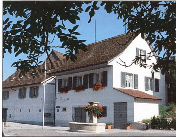
Altes Spritzenhaus Adlikon mit Anbau (Fuerwehrschoopf)