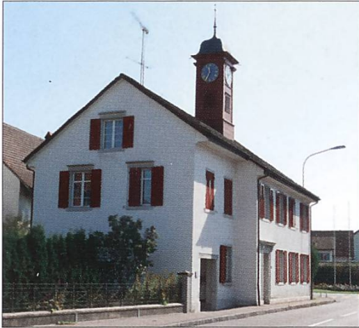
Altes Spritzenhaus Watt, 1850 zum Schul- und Spritzenhaus erweitert

Verbesserungen feuersicherer gemacht (Holzteile durch Riegel ersetzt: Kosten 150 Franken). 1832 fasste auch die Zivilgemeinde Regensdorf den Kauf einer neuen Spritze ins Auge, die alte wurde als ungenügend befunden. 1835 konnte die Spritze von Meister Gross in Unterstrass übernommen werden. 1849 erstand Regensdorf eine neue Spritze. 1844 wurde auch Watt vom Statthalteramt angewiesen eine neue Spritze zu kaufen, aber die sparsamen Watter zogen es vor, ihre alte restaurieren zu lassen. 1850 machten sie dann eine «bedeutende Erweiterung» des 1813 im Lagerbuch erfassten Watter Schulhauses, das nun zum «Schul- und Spritzenhaus» wird.