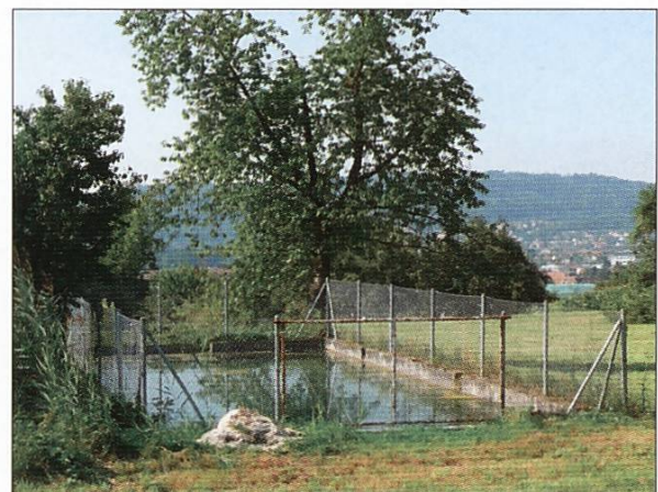
Feuerwehrweiher Watt, 2012