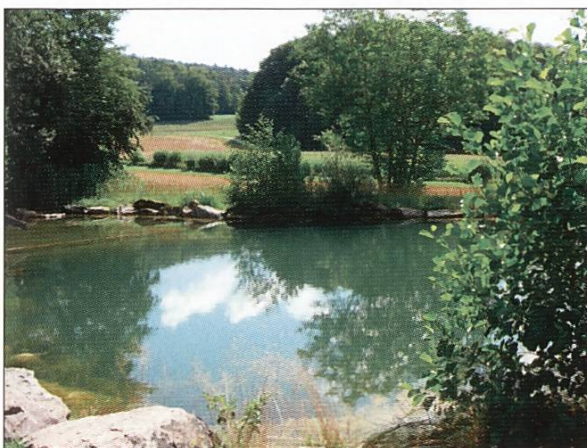
Feuerwehrweiher Boppelsen, 2012

Feuerwehrweiher. Eine der wichtigsten Obliegenheiten der Feuerwehrkommandanten war die Pflege der Feuerweiher, Wassersammler und Stauschwellen um an verschiedenen Punkten des Dorfes über genügend Löschwasser zu verfügen. Das Furttal war und ist ein wasserreiches Tal. Nur war das Wasser vor der Melioration vor allem in der grossen Ried-Ebene gebunden, für Feuerwehrzwecke denkbar ungeeignet. So wurden schon in vorhergehenden Jahrhunderten «Feuerweiher» oberhalb der Dörfer an den Hängen des Tales angelegt und definiert, die im Brandfall gezielt in den Dorfbach entleert werden konnten, damit das Wasser möglichst nahe am Brandplatz an Schwellen wieder aufgestaut werden konnte. Noch heute bekannt ist der noch immer so benannte Feuerwehrweiher in Boppelsen; aber auch die anderen Dörfer hatten ihre Feuerweiher oder Wassersammelstellen, wie sie von den kantonalen Gesetzen und Feuerwehrverordnungen vorgeschrieben wurden. Diese Löscheinrichtungen bestanden schon vor der Franzosenzeit. 1817 erfahren wir aus Dällikon, dass der Feuerweiher sich in einem schlechten Zustand befinde.