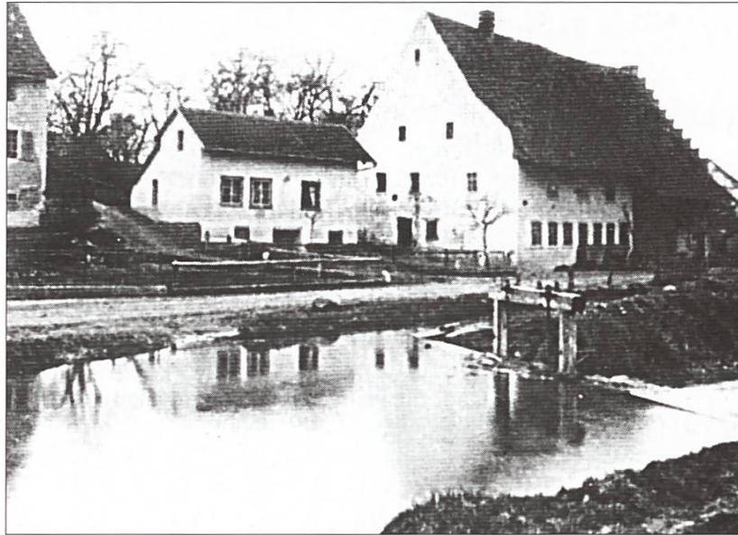
Das alte Bachwehr (Staustufe) in Würenlos hatte bestand bis in die 1920er Jahre

Feuerwehrweiher. Eine der wichtigsten Obliegenheiten der Feuerwehrkommandanten war die Pflege der Feuerweiher, Wassersammler und Stauschwellen um an verschiedenen Punkten des Dorfes über genügend Löschwasser zu verfügen. Das Furttal war und ist ein wasserreiches Tal. Nur war das Wasser vor der Melioration vor allem in der grossen Ried-Ebene gebunden, für Feuerwehrzwecke denkbar ungeeignet. So wurden schon in vorhergehenden Jahrhunderten «Feuerweiher» oberhalb der Dörfer an den Hängen des Tales angelegt und definiert, die im Brandfall gezielt in den Dorfbach entleert werden konnten, damit das Wasser möglichst nahe am Brandplatz an Schwellen wieder aufgestaut werden konnte. Noch heute bekannt ist der noch immer so benannte Feuerwehrweiher in Boppelsen; aber auch die anderen Dörfer hatten ihre Feuerweiher oder Wassersammelstellen, wie sie von den kantonalen Gesetzen und Feuerwehrverordnungen vorgeschrieben wurden. Diese Löscheinrichtungen bestanden schon vor der Franzosenzeit. 1817 erfahren wir aus Dällikon, dass der Feuerweiher sich in einem schlechten Zustand befinde.