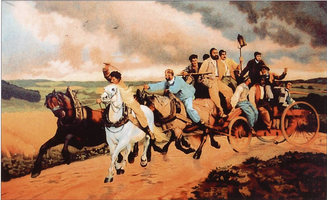
Reiter mit Spritze

Die Feuerspritze hat auch hier als Symbol der Dorfgemeinschaft die Kirche hinter sich gelassen. 1849 beschwert sich der Pfarrer von Regensdorf darüber, dass die Übungen am Sonntag stattfinden und nicht nur die Feuerwehrmänner vom Kirchengang abhalten, sondern auch die Sonntagsruhe stören.