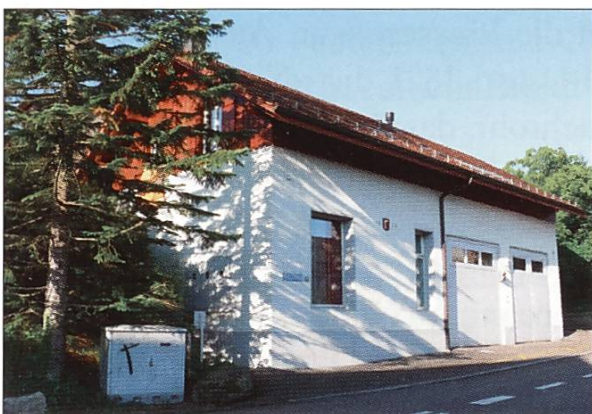
Altes Spritzenhaus Dällikon

Aber die Löscharbeiten haben vielleicht Mängel gezeigt und die Däniker zu einer eigenen Feuerwehr, zur Trennung von der Gemeinde Dällikon und zum Streit über die Neuverteilung der Kirchenorte in der gemeinsamen Kirche geführt.