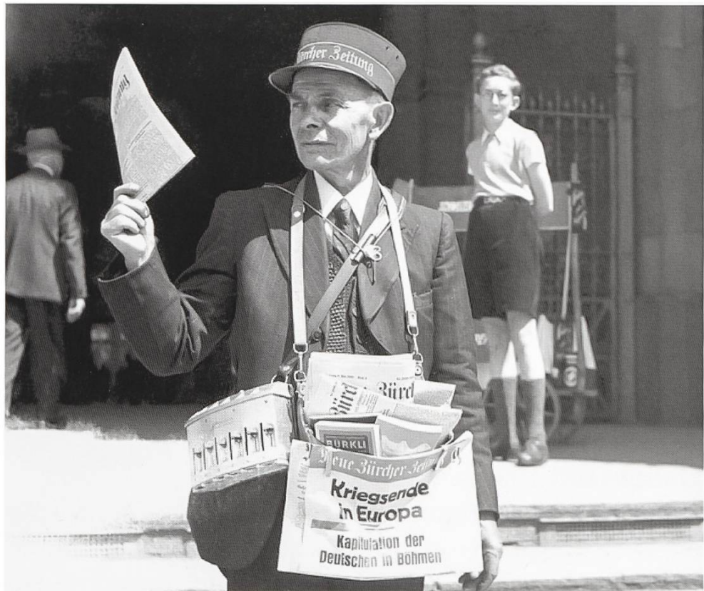
Ein Zeitungs- verkäufer am 8. Mai 1945 vor dem Zürcher HB