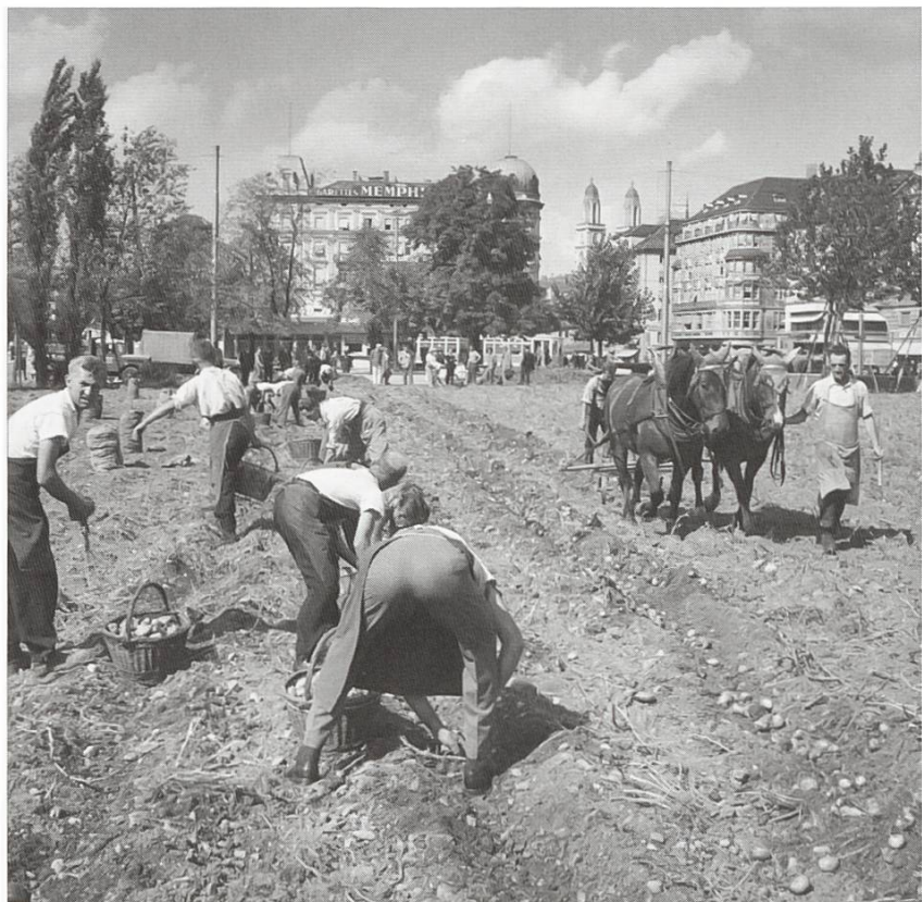
Kartoffelernte 1942 auf dem Sechseläutenplatz

Nebst den Rationierungen sorgte auch die unter dem Namen «Plan Wahlen» bekannt gewordene, ab Dezember 1940 lancierte Anbauschlacht für die Sicherung der Landesversorgung.