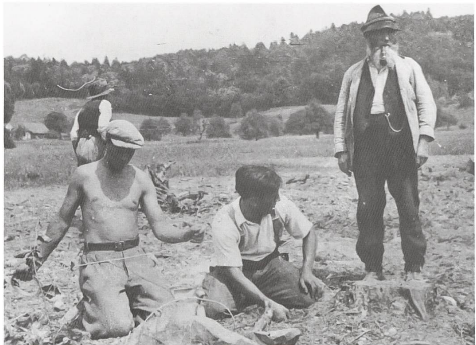
Der Plan Wahlen, auch bekannt als Anbauschlacht, erforderte die Rodung des Tägerhardwaldes

Der Protest nützte nichts. Am 24. Dezember 1942 wurde verfügt, dass die vorgesehene Rodung unverzüglich durchzuführen und bis Mitte März 1943 abzuschliessen sei. Am 1. Februar wurden die Rodungsarbeiten aufgenommen; sie erstreckten sich auf 10.92 Hektaren Gemeindewald und 3.63 Hektaren Staatswald. Das Abholzen des Gemeindewaldes ergab 2'863 Kubikmeter Bauholz, 30 Ster Papierholz, 2'870 Ster Brennholz und 24'075 Reisigwellen. Der Gesamterlös belief sich auf über 223'000 Franken. Mitte Juni 1943 waren die Arbeiten, bei denen total 330 Personen mit 100'243 Lohnstunden Beschäftigung gefunden hatten, beendet. Im Ganzen wurden 135'683 Franken Löhne entrichtet. Der grösste Teil der Rodungsfläche wurde an das eidgenössische Kriegsernährungsamt verpachtet. Nach dem Krieg wurde ein Teil des Areals an den Unternehmer Huber, Baden (heute Huba Control) verkauft. 4