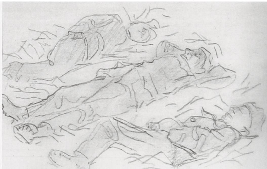
Nach anstrengender Arbeit konnte man problemlos auf einem Strohlager schlafen (Zeichnung J. Dublin)

Im Herbst 1939 befahl General Guisan, die Limmatstellung massiv auszubauen. Deshalb rückten zuerst ältere Soldaten aus dem Bernbiet bei uns ein. Der von ihnen erstellte «Bernerpfad» im Gmeumeri erinnert noch an sie. Nach den Bernern kamen mit dem 2. Füsilierbataillon 87 vom Regiment 12 viele junge Urner nach Würenlos. Sie schliefen mit ihren Wolldecken auf dem Stroh in den verschiedenen Sälen der Restaurants und im Gmeindschäller.