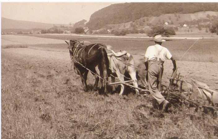
Wenn die Pferde fehlten, musste auch mit Rindern das Feld gepflügt werden

Gottlob waren die Schwiegereltern noch da und halfen mit. Meist hatten wir einen Knecht aus Italien oder Österreich. Man hatte erst wenige Maschinen, aber noch weniger Vieh. Wir Bauern waren bezüglich Essen natürlich besser dran als die andern. Wir hatten einen grossen Gemüsegarten, Fleisch und Milch und konnten selber Brot backen. Deshalb haben wir ärmeren Leuten hie und da ein Brot gegeben, zum Beispiel einer Familie mit vier Kindern, deren Vater an einer Lungenentzündung verstorben war. Überhaupt half man sich gegenseitig aus, auch in der Landwirtschaft. Da wir die Pferde dem Militär zur Verfügung stellen mussten, haben wir mit Kühen ge-