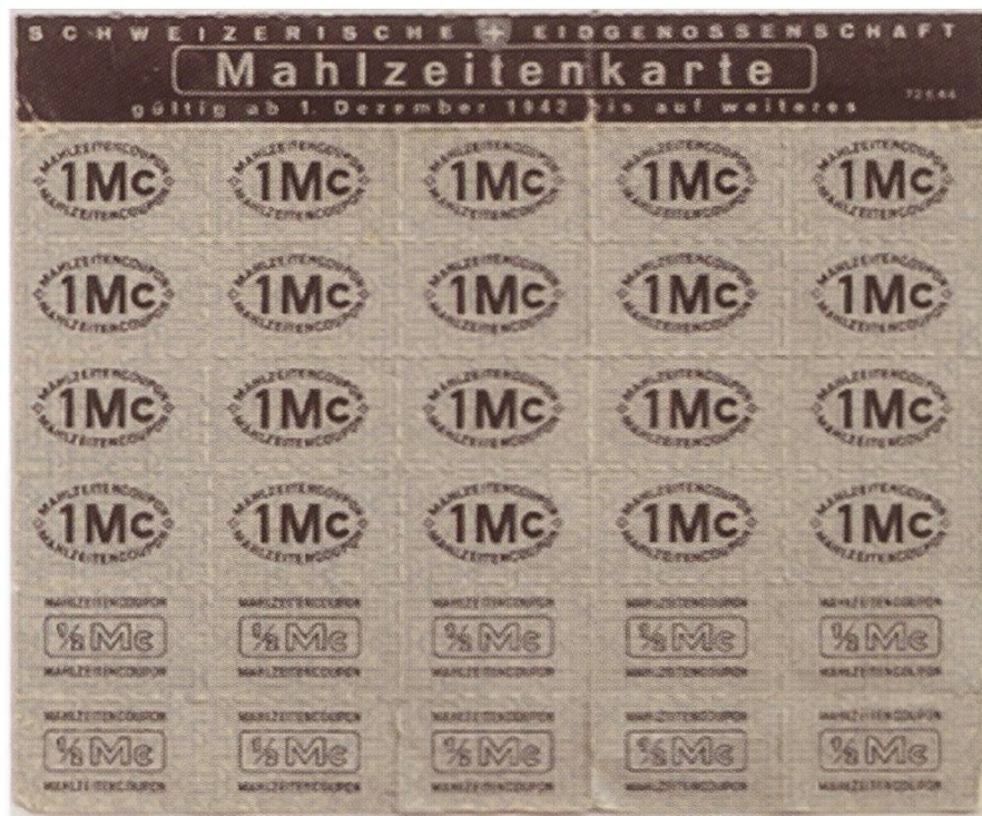
Die meisten Lebensmittel konnten nur noch mit Lebensmittelmarken eingekauft werden

Auch in Würenlos waren Soldaten einquartiert. In der Waschküche des «Steinhof» war eine der vielen Soldatenküchen eingerichtet. Die Fouriere kauften tüchtig bei den Würenloser Bauern und Geschäften ein, was einen willkommenen Zusatzverdienst bedeutete. In diesen Küchen wurde meist bewusst zuviel von der schmackhaften Suppe mit Spatz gekocht. So konnte die ärmere Dorfbevölkerung bald reihenweise anstehen, um ein Kesseli warme Suppe nach Hause zu tragen – und das ohne Lebensmittelmarken einsetzen zu müssen.