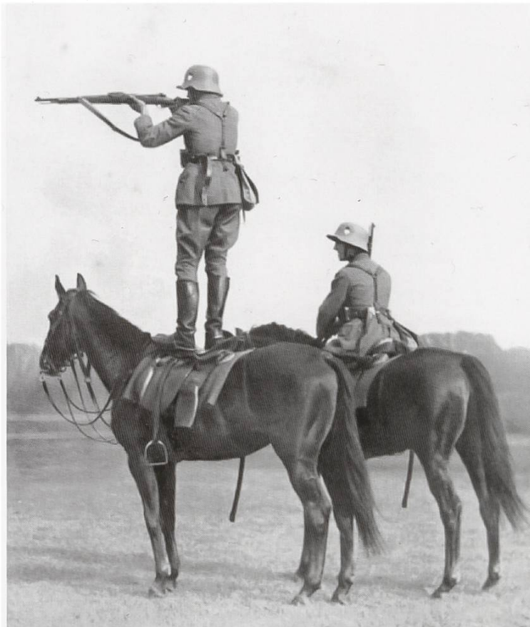
Die Armee requirierte auch Pferde von Würenloser Bauern

Mein Vater war auch Pferdehändler und hatte immer etwa 20 bis 25 Tiere, die er an Bauern oder an die Armee verpachtete. Die Pferdepreise stiegen. Während der Mobilmachung musste ich dann einige dieser Pferde bei Bau-