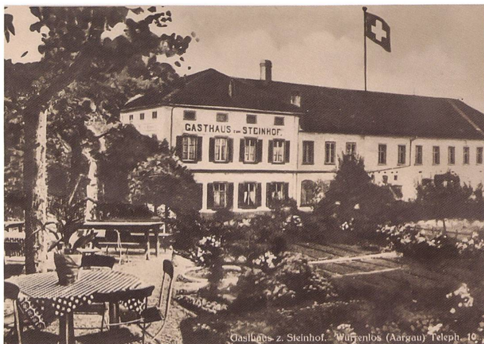
Postkarte Gasthaus «Steinhof» mit Telefonnummer 10

wurde, überall die Kirchenglocken läuteten und bald die Aufgebotsplakate aufgehängt wurden, hatten wir grosse Angst. An diesem Tag konnte man im Konsum noch frei einkaufen, sogar bis 24 Uhr, was die Wohlhabenderen ausgiebig nutzten, während andere mangels Bargeld nicht mithalten konnten.