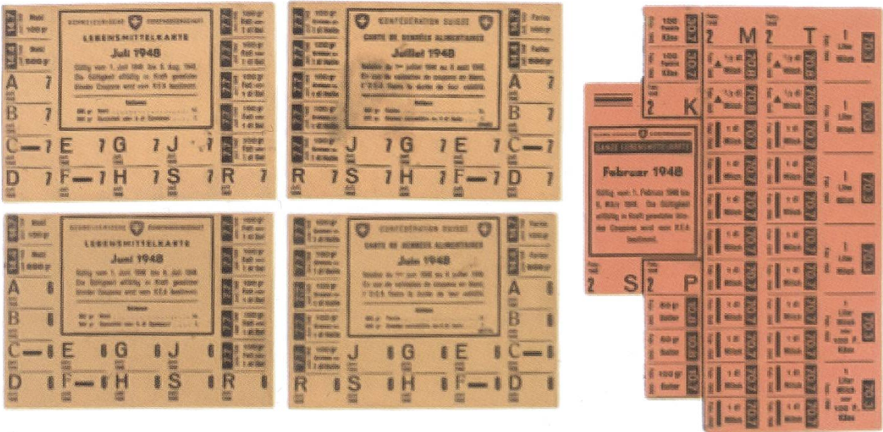
Gewisse Lebensmittel blieben bis 1948 rationiert

und überlegen, wo noch irgendetwas aufzutreiben war. Viele Lebensmittel wie Milch, Brot, Fleisch, Öl und Zucker sowie Verbrauchsartikel wie Seife waren bis ins Jahr 1948 rationiert oder sonst nur schwer erhältlich. Für die Zähne war der verminderte Zuckerkonsum allerdings vorteilhaft.