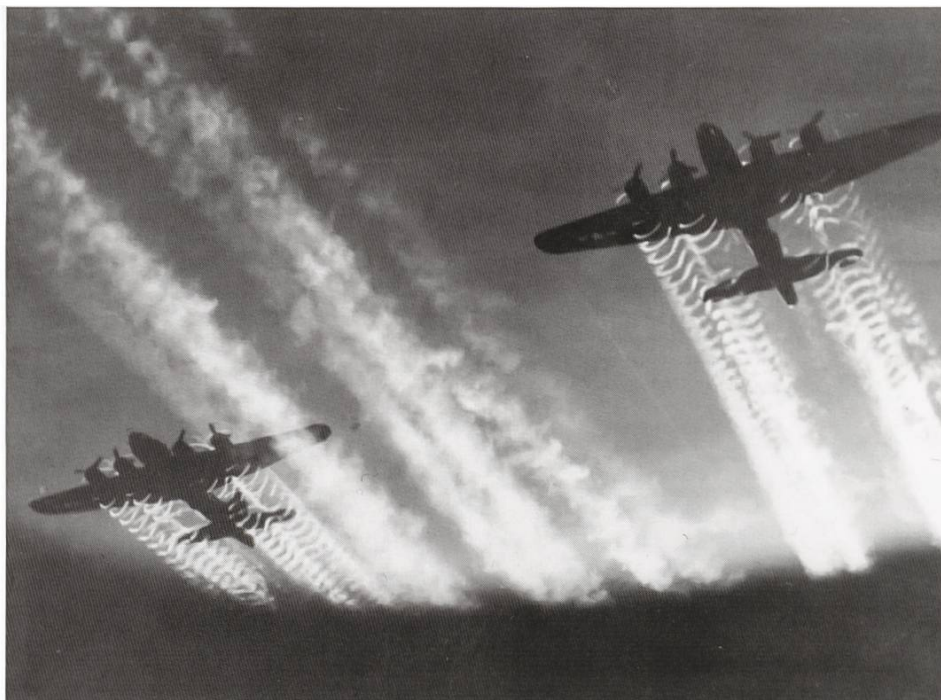
Das Furttal wurde mehrfach von Bombern überflogen

Bombern, hauptsächlich amerikanischen, überflogen. Dabei wurden diese von unserer Fliegerabwehr mittels grosser Scheinwerfer am Himmel gesucht. Diese Scheinwerferlichter konnten ganz klar gesehen und verfolgt werden, was eine grosse innere Unruhe und damit auch Angst auslöste. In jedem Dorf gab es bald eine Ortswehr aus meist älteren, nicht mehr dienstpflichtigen Männern. Sie besaßen auch ein Gewehr, denn sie hätten die Aufgabe gehabt, die gefürchteten deutschen Fallschirmjäger festzunehmen. Ich selbst war bei der Ortswehr als Meldefahrer eingeteilt.