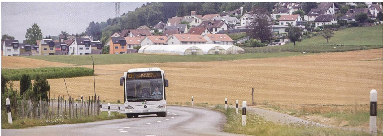
Abbildung 96: Busbetrieb von Hüttikon nach Würenlos um 2014

Der nur etwas mehr als einen Kilometer lange Anschluss an den öffentlichen Verkehr in den Kanton Aargau kann lange Zeit nicht realisiert werden. Eine Abklärung im Jahre 1988 über die Einführung einer Buslinie Hüttikon-Würenlos-Killwangen-Spreitenbach wird von Spreitenbach nicht befürwortet, und da das Projekt den finanziellen Rahmen für Hüttikon übersteigen würde, wird es nicht weiter verfolgt.