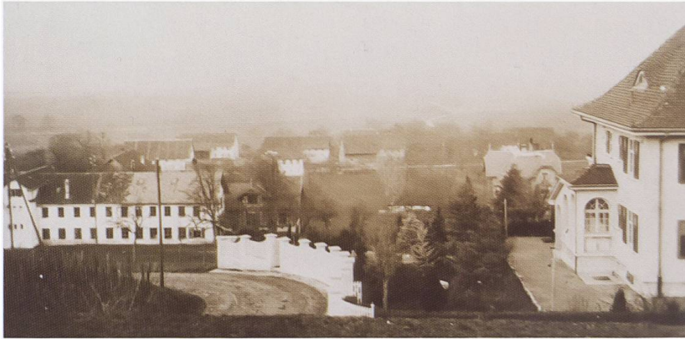
Abbildung 99: Die noch ungeteerte «Güller-Kurve» am Hüttikerberg in den 1950er-Jahren, wo auch heute immer wieder Unfälle geschehen (Postkarte)

grund, und die Dorfbevölkerung behilft sich mit einem Gemisch aus verschiedenen Altölen. Dabei wird der sogenannte «Teersaft» über die gesamte Strasse verteilt, um den Staub zu reduzieren.