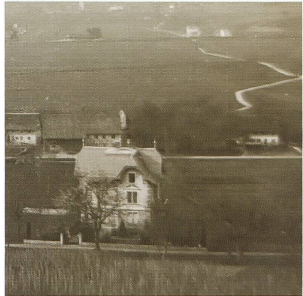
Abbildung 101: Das kurvenreiche Strässchen 1912 von Hüttikon nach Otelfingen. Im Vordergrund: Rebenanbau und Güller-Villa. (Postkarte)