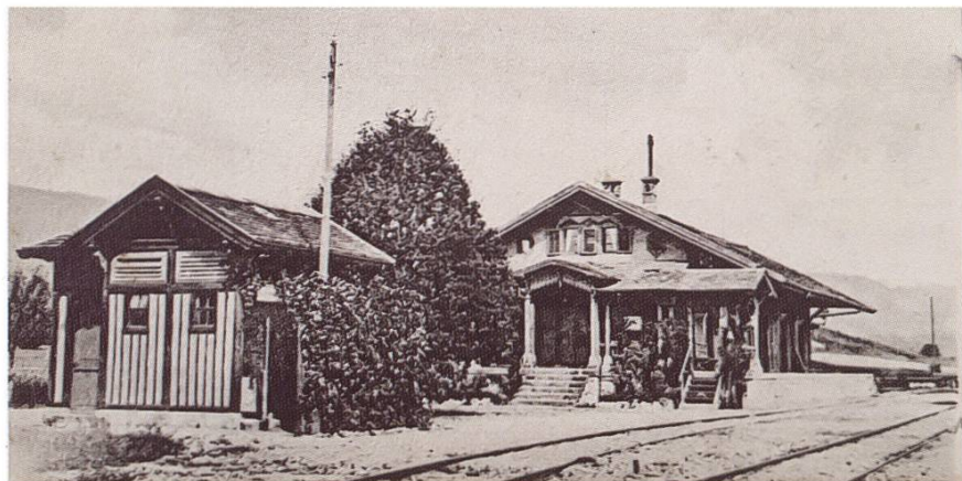
Abbildung 95: Bahnhof Otelfingen 1904 (Postkarte)

Die Strecke von Wettingen nach Zürich-Oerlikon wird 1942 elektrifiziert und erhält damit den Anschluss an die neue Technologie. Im Frühling 1990 wird im Furttal die S-Bahn der Linie 6 eingeweiht. Damit wird Otelfingen mit dem Zürcher Hauptbahnhof direkt verbunden und das Umsteigen in Zürich-Oerlikon entfällt. Die Züge verkehren jedoch vorerst nur während den Stosszeiten im Halbstundentakt. Erst im Dezember 2007 wird der Halbstundentakt bis nach Otelfingen eingeführt.