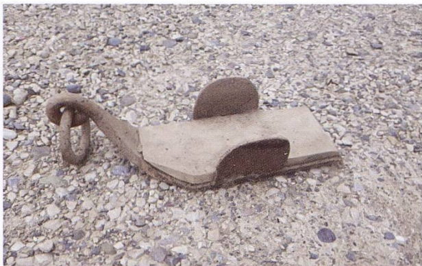
Abbildung 97: Brems-Schuh von Ruedi Bopp, Hüttikon

Die Oetwilerstrasse, welche die Verbindung zum Hüttikerberg und weiter zur Gemeinde Oetwil bildet, weist eine Steigung von bis zu 17 Prozent auf: Diese rund ein Kilometer lange Steigung führt vom Dorf Hüttikon von 433 Meter über Meer bis zum Hüttikerberg auf 521 Meter über Meer und ist in den 1950er-Jahren noch eine Schotterstrasse. Für die steile Abfahrt vom Hüttikerberg hinunter nach Hüttikon verwenden die Bauern mit ihren vollbeladenen Wagen den sogenannten «Brems-Schuh». Dabei wird ein Radschuh aus Eisen mit einer Kette am eisenbereiften Rad des Holzwegens angebracht, womit das Rad blockiert werden kann. Unten angekommen wird der Brems-Schuh wieder entfernt.