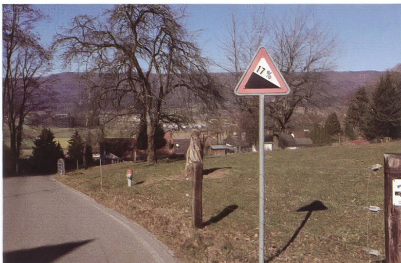
Abbildung 103: Hinweisschild 17 Prozent-Steigung auf dem Hüttikerberg

Als die Nordumfahrung mit dem Gubristtunnel eröffnet wird, entlastet dies zunächst den Verkehr durch das Furttal. Die Verkehrssituation – auch diejenige in Hüttikon – ist jedoch nach wie vor nicht immer rosig. Bei Stausituationen am Gubristtunnel weichen die Autofahrer oft auf die Strecke zwischen Würenlos und Regensdorf oder auch über den Hüttikerberg aus. Durch den Bau der dritten Röhre durch den Gubrist, der 2022 abgeschlossen sein soll, erhoffen sich die Hüttiker eine weitere Entlastung.