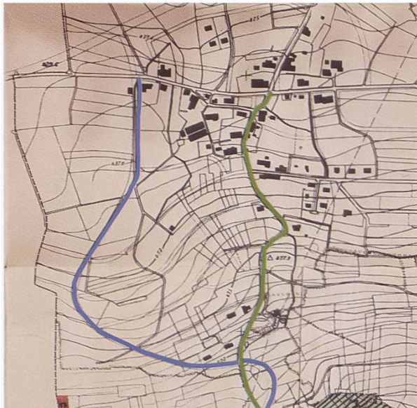
Abbildung 100: Karte von Hüttikon um 1950. Während die grüne Linie die aktuelle Strasse auf den Hüttikerberg zeigt, wird mit der blauen Linie die mögliche Umfahrung angezeigt. (Darstellung: Sabine Moser-Schlüer)

Ende der 1950er-Jahre, als der Autoverkehr in der Schweiz zunimmt, sollen die Hüttiker Strassen generell mit einem Belag versehen werden. Am 18. März 1961 stimmt die Gemeindeversammlung zu, dass die Strasse auf den Hüttikerberg geteert werden soll. In diesem Zusammenhang kommt die Idee einer weniger steilen Umfahrung auf, die weiter westlich auf den Hüttikerberg führen soll. Die Idee wird jedoch verworfen.