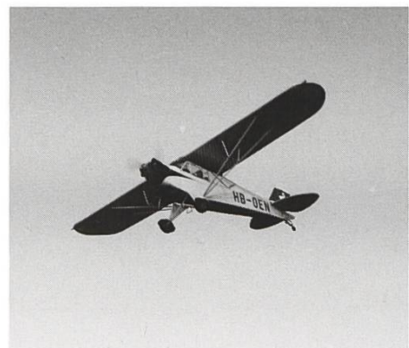
Abbildung 102: Ungefähr so müsste das Flugzeug ausgesehen haben: Piper, HB-OEN im Flug

Am 14. März 1954 berichtet die NZZ von einem Piper-Flugzeug auf dem Hüttikerberg: Das Sportflugzeug HB-OUK ist im Besitz der Fliegerschule Spreitenbach. Der Sportflieger und sein Passagier wollen zum damaligen Flugplatz Dällikon fliegen. Die Bewohner des Hüttikerbergs können das Flugzeug aus nächster Nähe beobachten. Mit dem Flugzeug scheint zwar alles in Ordnung zu sein, doch es fliegt sehr tief und kommt beängstigend nahe an ihre Häuser. Am Waldrand kommt das Flugzeug nicht mehr über eine hoch emporragende Tanne hinaus und prallt gegen den Baum. Der Stamm des Tannenbaums wird durchschlagen und das Flugzeug stürzt 250 Meter südwestlich des Hüttikerbergs ab. Die Bewohner des Hüttikerbergs eilen zur Absturzstelle, um erste Hilfe zu leisten. Der Pilot sitzt blutüberströmt auf seinem Sitz und gibt nur schwache Lebenszeichen von sich. Der Passagier scheint bewusstlos zu sein. Die Sanität bringt die beiden Schwerverletzten ins Krankenhaus. Sie kommen mit einem blauen Auge davon: Der Pilot hat einen Schädelbruch, der Passagier mehrere Beinbrüche.