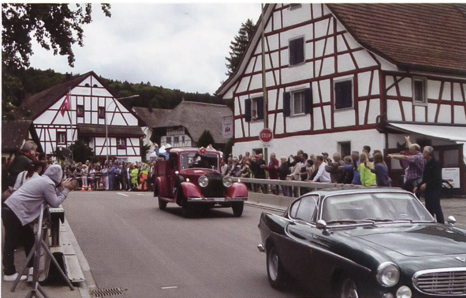
Abbildung 150: Charity-Fahrt 2017

Gemäss einer statistischen Auswertung im Jahre 2014 ist Hüttikon am besten motorisiert: Auf 679 Einwohner kommen 508 Autos. Nirgends sonst im Kanton Zürich gibt es so viele Autos pro Person. Die Gründe dafür liegen auf der Hand: Im Dorf gibt es nur wenig Infrastruktur: keinen Bahnhof, keinen Lebensmittelladen, keine Post... Und so besitzt fast jede Familie in Hüttikon mindestens zwei Autos.