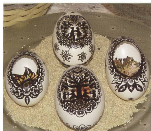
Abbildung 148: Scherenschnitte auf Eiern von Hedy Bürki, Rothenbach, an der Ostereierausstellung 2018