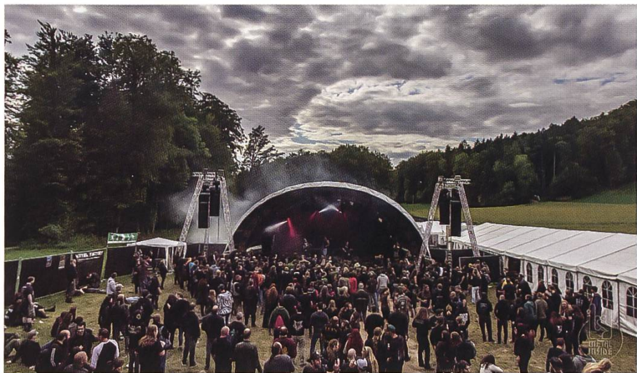
Abbildung 149: Das Meh-Suff- Festival auf dem Hüttikerberg 2015

Jeweils im September, wenn die grossen Metal-Festivals vorüber sind, findet auf dem Hüttikerberg das Festival «Meh Suff!» statt. Es hat sich in kurzer Zeit – der erste Anlass findet im Jahre 2008 statt – zu einem wichtigen Anlass in der Schweizer Heavy Metal-Szene entwickelt. Bands aus der ganzen Welt treten auf und 1500 Besucher werden jeweils erwartet.