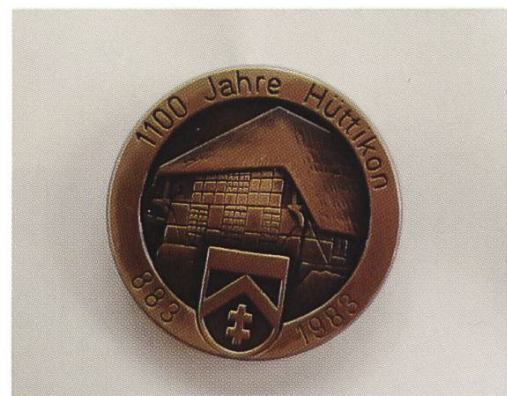
Abbildung 145: Festabzeichen 1100 Jahre Hüttikon

Am 26. bis 28. August 1983 findet in Hüttikon die 1100-Jahrfeier statt. Der Gemeinderat bewilligt einen Kredit von 3700 Franken. Dieser soll, so weit möglich, durch den Verkauf von Abzeichen, die die Firma Güller Söhne zur Verfügung stellt, und von Sport- und Einkaufstaschen mit Abbildung des Strohdachhauses gedeckt werden. Das Fest wird durch die Vereine organisiert. Das Forum Hüttikon führt vor dem Strohdachhaus einen Flohmarkt durch und bietet im Strohdachhaus Raclette, Kaffee und Kuchen an. Im Feuerwehrlokal können Steaks und Würste gegessen werden. Im Postlokal werden Spaghetti Bolognese angeboten. Im Keller von Hans Imhof gibt es Gnagi und der Jodlerklub Altberg und die Trachtenvereinigung Furttal bereichern die Veranstaltung mit verschiedenen Darbietungen. Für den offiziellen Teil am Samstag begrüsst der Gemeinderat Delegationen des Regierungsrates – darunter Regierungsrat Jakob Stucki –, des Bezirksrates, der Gemeinden des Furttales, die Mitglieder der Rechnungsprüfungs-Kommission, der Primarschulpflege, der Oberstufenschulpflege sowie der Kirchenbehörden.