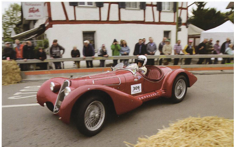
Abbildung 151: GP-Furttal 2017

Heute wird der GP Furttal alle zwei Jahre ausgetragen, abwechselnd in Dänikon-Hüttikon und in der Industrie Dällikon. Bis zu 10 000 Zuschauer von Nah und Fern strömen herbei, um dem Spektakel beizuwohnen. Viele Anwohner laden sogar Freunde und Bekannte ein, bringen ihre Stühle und den Grill mit und veranstalten so ihre eigene kleine Feier vor Ort.