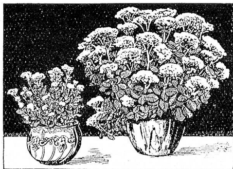
ohne und mit Fleurin