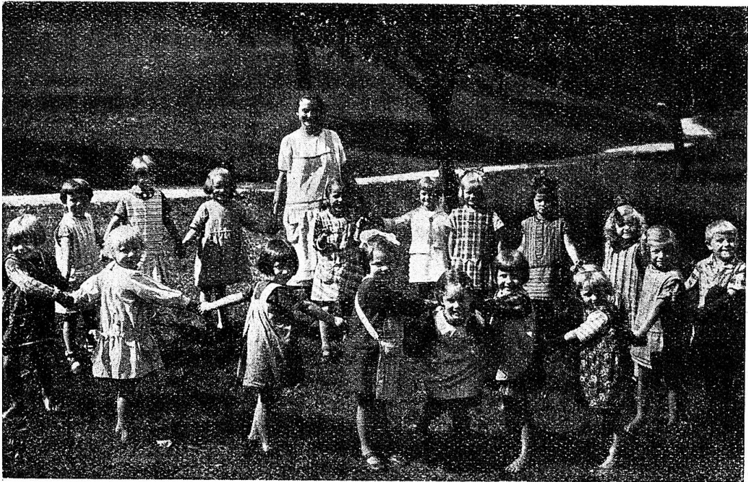
Kindergärtnerin und Kinder spielen auf der grünen Wiese.

den Verein in Kontakt gebracht mit Kreisen, die eine vermehrte Wertung des Fraueneinflusses anstrebten. In ihren Fusstapfen sind ihre Nachfolgerinnen weitergegangen und so kommt es, dass heute kaum ein Frauenwerk in unserem Lande geschaffen wird, bei dem man nicht auch die Mitwirkung der Lehrerinnen gesucht und gefunden hätte. Und dabei vollzieht sich ein schöner Wechsel in Geben und Nehmen. Der Schweizerische Lehrerinnenverein muss sich so mit einer Reihe von Fragen beschäftigen, die sich in seinem eigenen Tätigkeitsgebiet nicht stellen würden. Das bedeutet aber eine Erweiterung des Horizontes für diejenigen, die die Geschäfte leiten, und für diejenigen, an die sie die Kunde von all diesen Dingen weitergeben. Möge es dem Schweizerischen Lehrerinnenverein so gelingen, einer Gefahr zu entgehen, der eine Berufsorganisation so leicht erliegt, nämlich der Gefahr, alles nur vom Blickpunkt des eigenen Standes aus zu betrachten und damit der Wirkungsmöglichkeiten auf das Gemeinschaftsleben aller verlustig zu gehen.