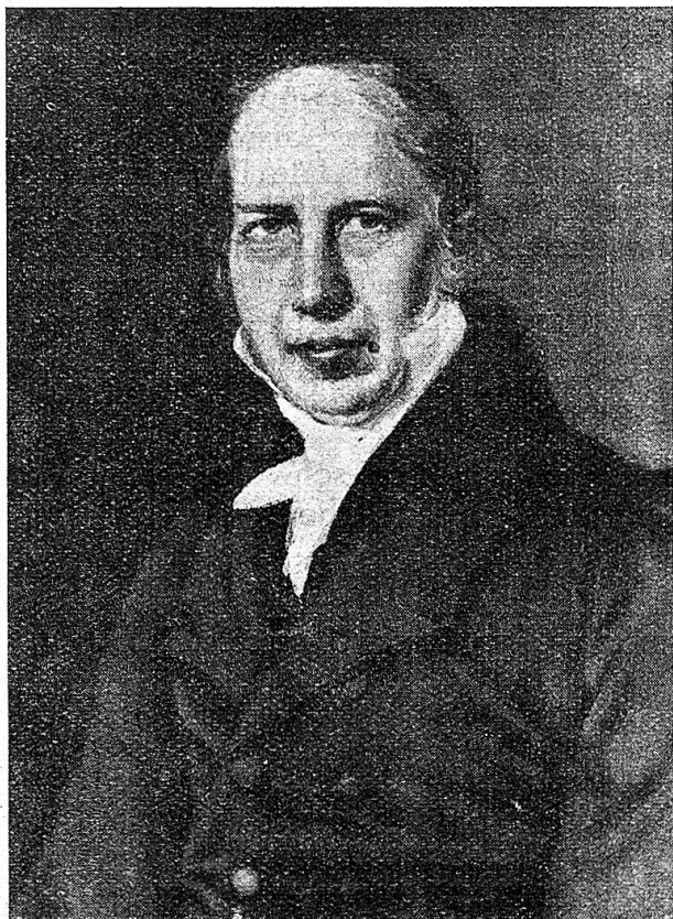
Nikolaj Frederik Severin Grundtvig 1783—1872 Der Gründer der Volkshochschule.

Zusammenhang verbunden. Der Bauernstand in Dänemark steht auf einer kulturellen Stufe, die wir bei uns in der Schweiz erst noch auf- und auszubauen haben.