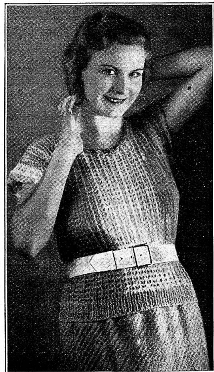
Gehäkelter Pullover, Grösse 44.

Vor Unglück ist kein Mensch versichert, Vor Schaden der, der sich versichert.