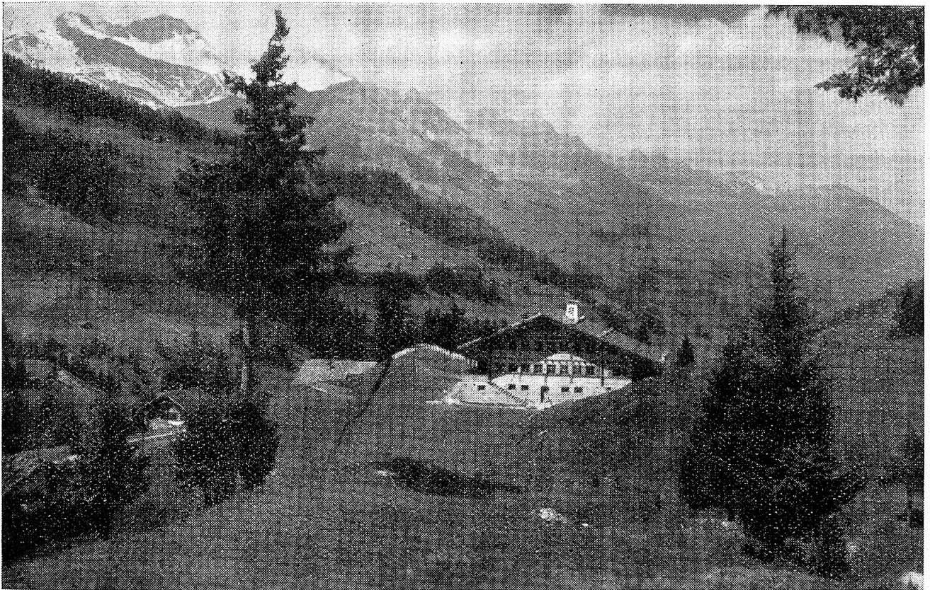
Internationales Pfadfinderinnen-Heim Chalet Eggetli, Adelboden

etwa blindlings die Knabenbewegung gleichen Namens kopiert. Es ist eine ausgesprochene Jugendbewegung und umfasst in der Hauptsache Mädchen vom 11.—20. Altersjahre. Politisch und religiös neutral stellen sich alle unter die gleiche freiwillige Disziplin. Die Uniform hilft gewisse Unterschiede überbrücken und gibt ein starkes Gefühl der Zusammengehörigkeit. In wöchentlichen Zusammenkünften möchte die Bewegung die