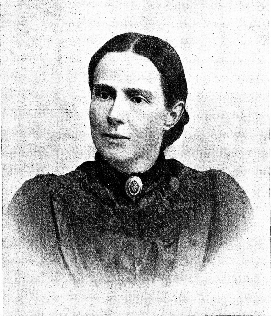
Dr. med. Marie Heim-Vögtlin