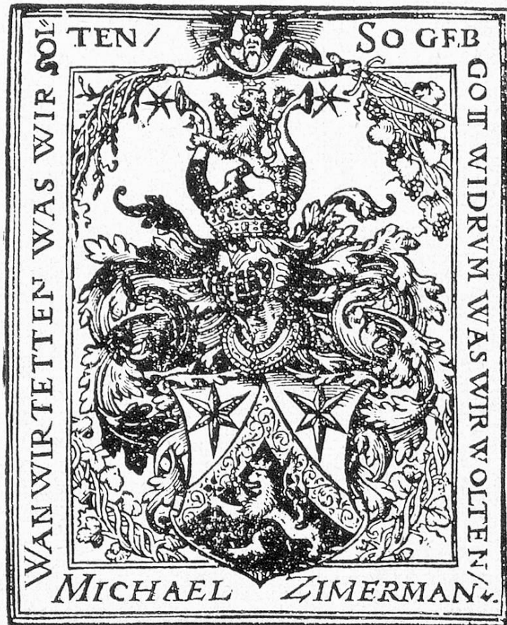
Das «gebesserte» Zimmermannwappen von 1559. Aus der syrischen Bibel von 1562 (Zentralbibliothek Zürich).

Auf der andern Seite brachte der Hof auch manche Aufträge, indem Zimmermann Mandate, Generalmandate, Ordnungen, Pa-