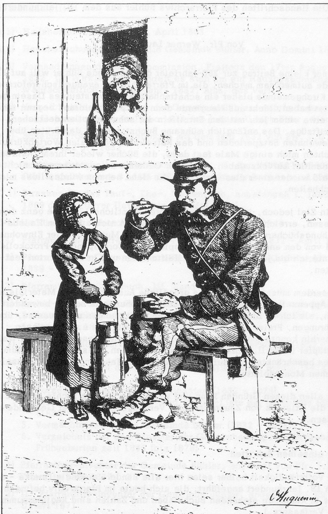
... C'était un solide gaillard aux traits accentués et énergiques ... (soldat bourbaki) (dessin d'Oscar Huguenin, tiré du livre «Derniers Récits», p. 101).