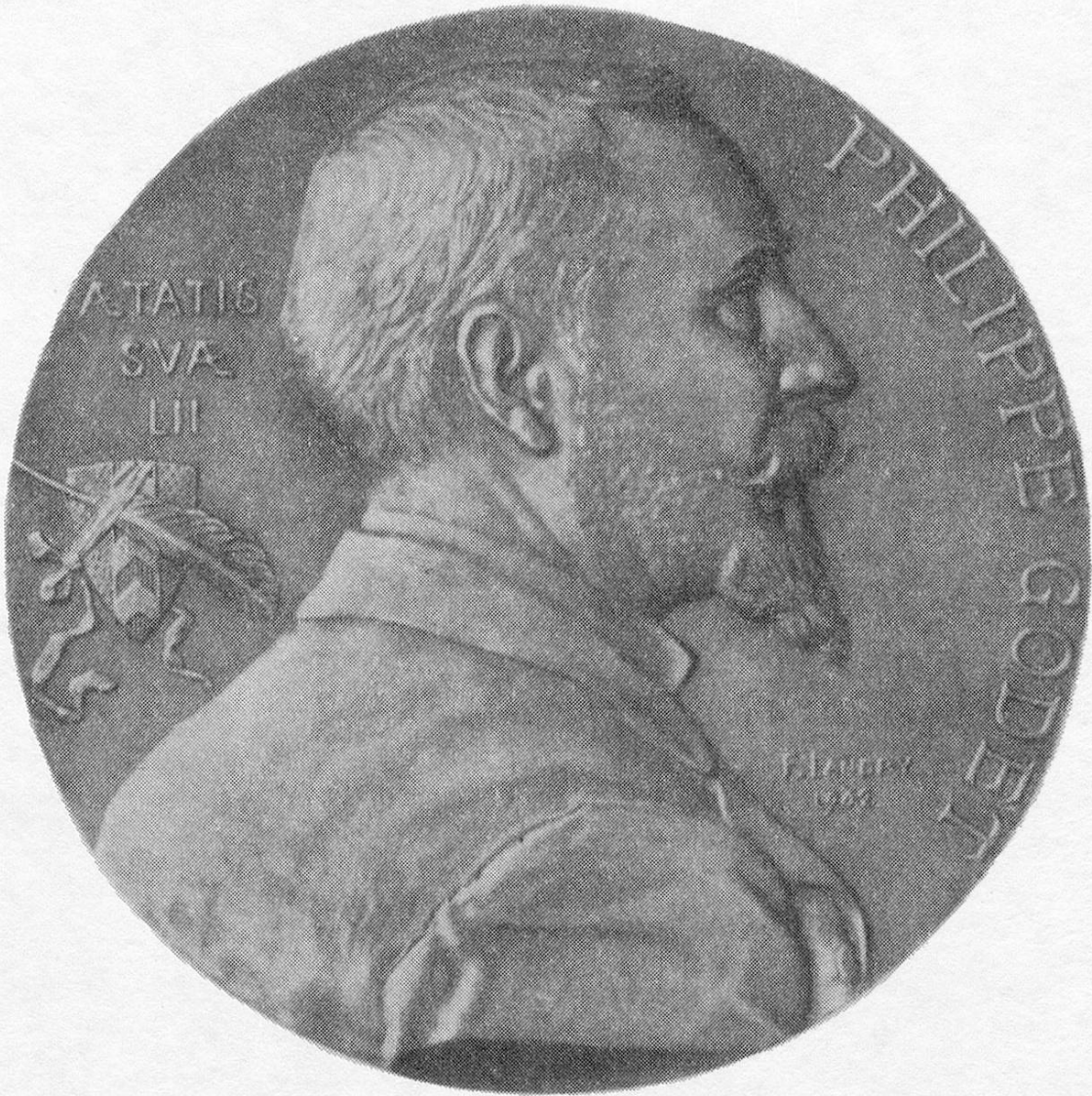
Médaille par Fritz Landry 1902