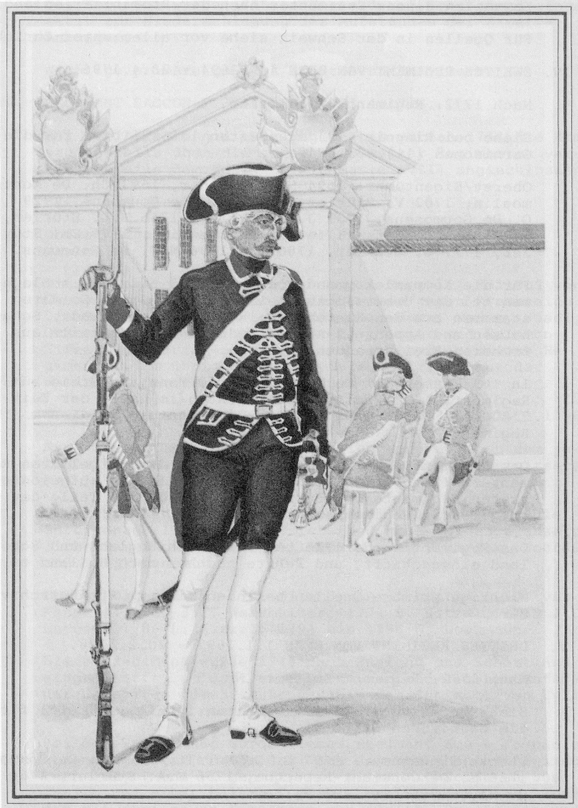
Füsilier Garde Regiment (XIII) 1773