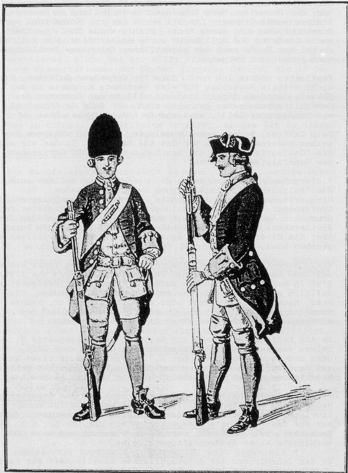
Grenadier und Füsilier Regiment Hirzel (VII) 1725