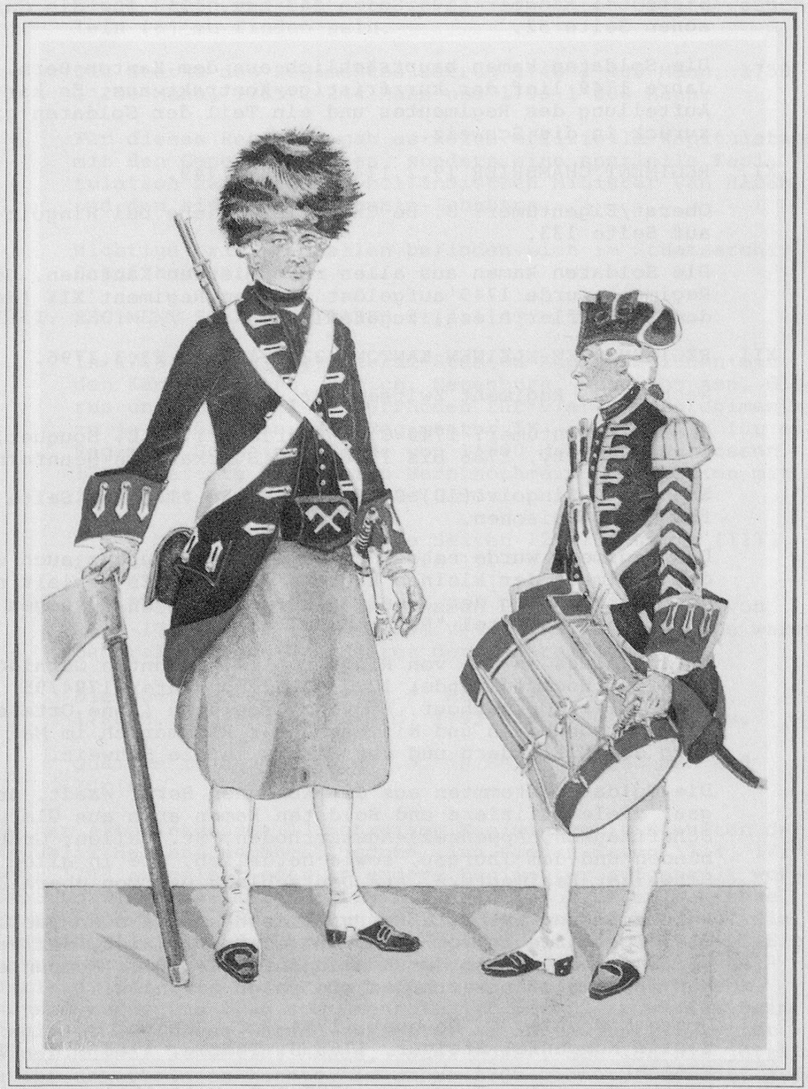
Zimmermann und Tambour Garde Regiment (XIII) 1753