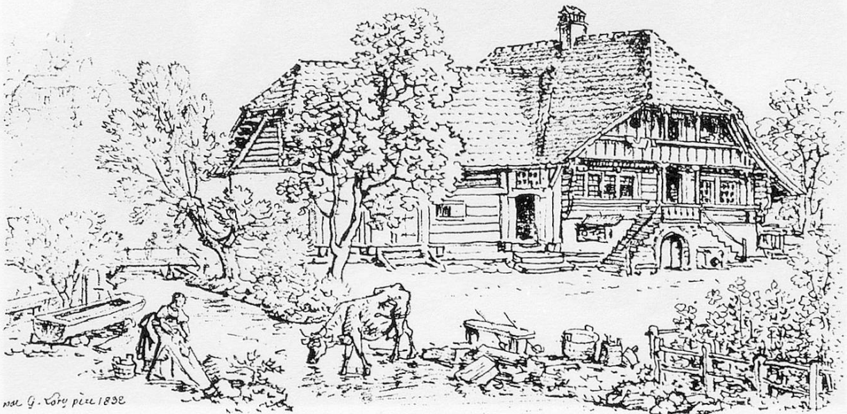
Maison paysanne fribourgeoise, dessin de Gabriel Lory père, 1832 (Bibliothèque universitaire, Neuchâtel)