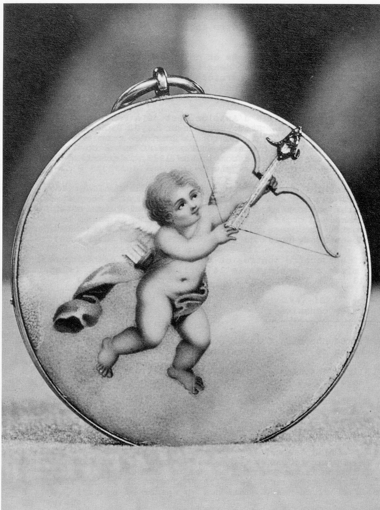
Figure 2. Montre à tacts (pour aveugle). Abraham Louis Breguet, Paris, l'an 8 (1799). Savonnette or avec peinture sur émail, cadran émail, échappement cylindre soigné.